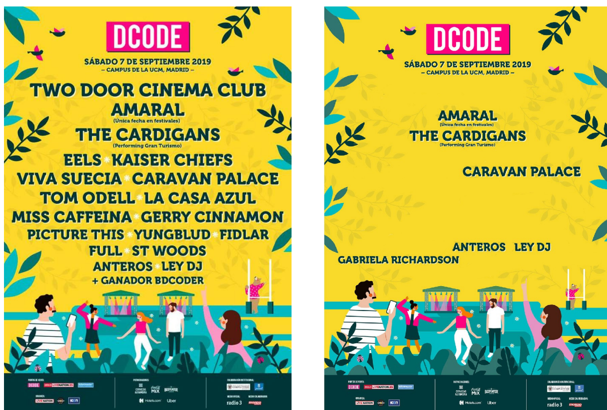
Imagen 1. El cartel original de DCODE 2019 y el cartel de artistas/bandas que incluyen mujeres entre sus componentes

En primer lugar, respecto a la composición por género del cartel, si realizamos el ya habitual ejercicio de visualización que consiste en eliminar materialmente de los carteles a los solistas y grupos compuestos exclusivamente por hombres, dejando a las solistas femeninas y las bandas mixtas (Cordobés 2017), la imagen del cartel quedaría prácticamente desierta, como mostramos en la Imagen 1. Hay que reseñar, sin embargo, que de las tres bandas que figuraban como cabezas de cartel, Two Door Cinema Club, Amaral y The Cardigans, dos de ellas sí tienen componentes femeninas (Amaral y The Cardigans).