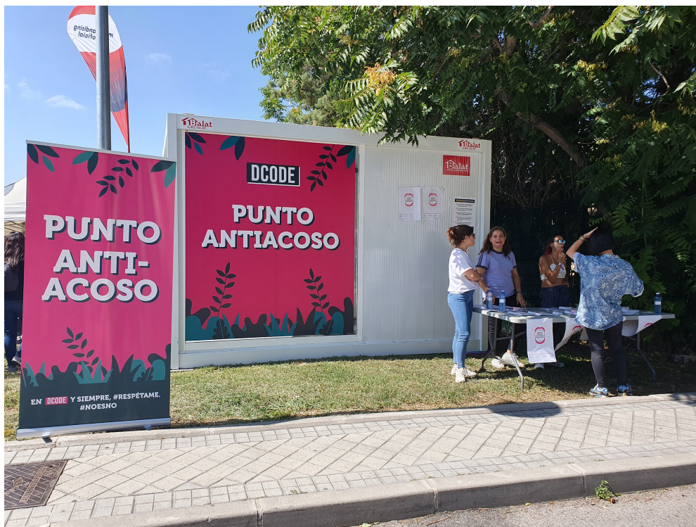
Imagen 2. Punto Antiacoso de DCODE 2019

El segundo aspecto evaluado es que DCODE instaló en el recinto un Punto Antiacoso con la función de “proporcionar información sobre el acoso sexual, sensibilizar y actuar en caso de ser necesario”, según nos manifestó la persona (mujer) que se declaró responsable de dicho stand en nombre de la Fundación Aspacia, subcontratada por el Área de Igualdad del Ayuntamiento de Madrid para este fin. El Punto estaba atendido en todo momento por tres personas, que pudimos comprobar que siempre fueron mujeres jóvenes, voluntarias, que habían recibido una formación específica de 4 horas de duración para poder atenderlo. Además, pudimos entrevistar también a la formadora de las voluntarias, trabajadora de la Fundación Aspacia, quien también estuvo presente varias horas. El Punto Antiacoso de DCODE 2019 permaneció abierto hasta las doce de la noche, como se puede comprobar en las imágenes tomadas (Imagen 2 y 3).