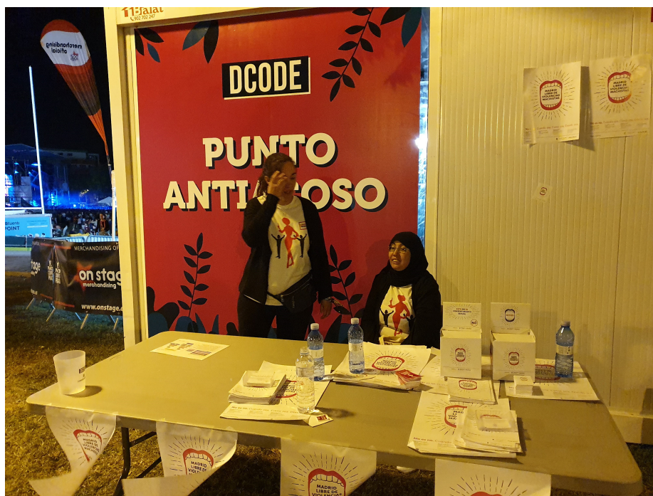
Imagen 3. El Punto Antiacoso de DCODE 2019 permaneció abierto hasta la medianoche

El Punto Antiacoso estaba perfectamente señalado en el mapa del Festival, tanto en los carteles del recinto como en la web (Imagen 4). Sin embargo, no aparecía entre las FAQs, entre las que sí figuraban cuestiones como ¿Qué pasa en caso de lluvia? o ¿Se podrá salir y volver a entrar al Festival? (puede consultarse la lista completa de preguntas en: https://dcodefest.com/faq.php ). Entendemos que la información relativa a dónde acudir en caso de sufrir una agresión sexual debería estar lo más accesible posible y por ello recomendamos también que se incluya en las Preguntas Frecuentes y que la web del Festival entre la información general proporcionada dedique un espacio a la concienciación sobre estas situaciones. Merece una valoración positiva que DCODE 2019 se sumara a las iniciativas emprendidas por otros festivales de lanzamiento de campañas con diferentes lemas: ‘No es no’ en el caso del Arenal Sound, Tolerancia cero’ en el caso del FIB y ‘Nuestro NO violeta’ del Rototom Sunsplash. El lema escogido por DCODE 2019, y que podía leerse en la cartelería del stand fue: “EN DCODE Y SIEMPRE #RESPÉTAME #NOESNO”.