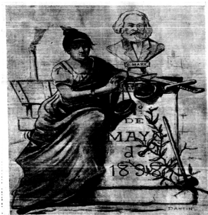
Figura 1. El dibujo 1º de mayo de 1898 (Dantin, 1898, 01 de mayo, p1)

Durante la segunda mitad del mes diciembre, El Socialista se convirtió en un espacio de discusión sobre la injusticia de Las Leyes de Dato 4 del trabajo de la mujer y del niño, y critica las inconveniencias hacia las mujeres. En consideración a las trabajadoras, se procura complementar la insuficiencia con el fin de defender al máximo los derechos de las obreras. En la ley, se prohíbe el trabajo nocturno de las mujeres en situaciones normales, y determina su periodo de trabajo más largo. Hace falta que se detalle más, porque “no se dice qué van a comer ese tiempo, ni se habla tampoco del periodo anterior al parto, con lo cual los beneficios de la ley resultarán pronto menos que ilusorios” (El trabajo de la mujer y del niño, 1898:2)