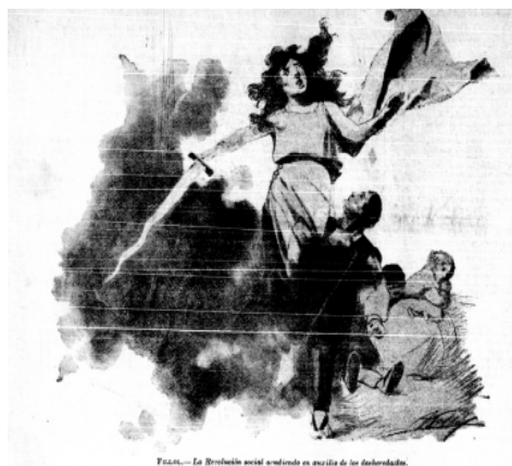
Figura 2. El dibujo La Revolución social acudiendo en auxilio de los desheredados (Fillol, 1898, 01 de mayo, p4)