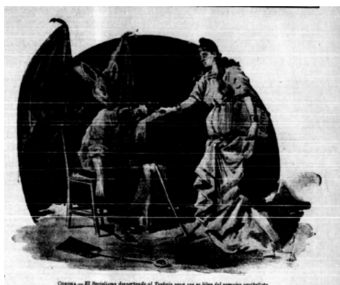
Figura 3. El dibujo El Socialismo despertando al Trabajo para que se libre del vampiro capitalista (Corona, 01 de mayo, p5)