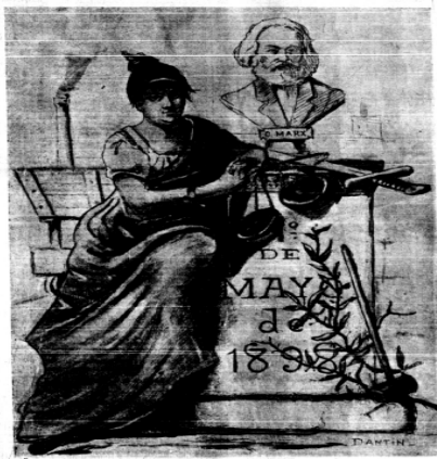
Figura 1. El dibujo 1º de mayo de 1898 (Dantin, 1898, 01 de mayo, p1)

Durante la segunda mitad del mes diciembre, El Socialista se convirtió en un espacio de discusión sobre la injusticia de Las Leyes de Dato 4 del trabajo de la mujer y del niño, y critica las inconveniencias hacia las mujeres. En consideración a las trabajadoras, se procura complementar la insuficiencia con el fin de defender al máximo los derechos de las obreras. En la ley, se prohíbe el trabajo nocturno de las mujeres en situaciones normales, y determina su periodo de trabajo más largo. Hace falta que se detalle más, porque “no se dice qué van a comer ese tiempo, ni se habla tampoco del periodo anterior al parto, con lo cual los beneficios de la ley resultarán pronto menos que ilusorios” (El trabajo de la mujer y del niño, 1898:2)