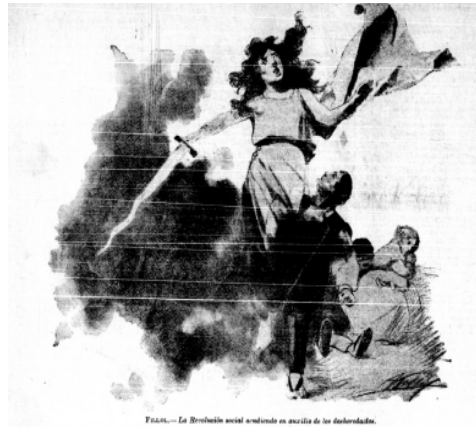
Figura 2. El dibujo La Revolución social acudiendo en auxilio de los desheredados (Fillol, 1898, 01 de mayo, p4)