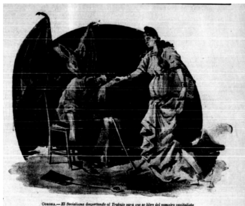
Figura 3. El dibujo El Socialismo despertando al Trabajo para que se libre del vampiro capitalista (Corona, 01 de mayo, p5)