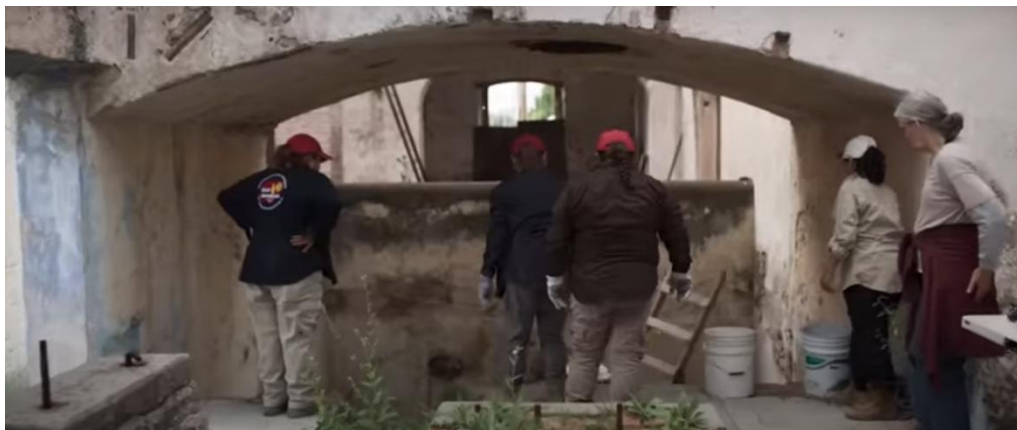
Figura 2. Fotograma de Noche de fuego . Escena: Rita y Ana se abrazan después de ser violentadas por el crimen organizado que han ido a buscar a Ana para levantarla.

El crimen organizado sabe que Ana ya es una adolescente, y por ello, se apremia a intimidar a Rita para que la entregue a la fuerza. El destino de Ana, como de cualquier hija adolescente en la comunidad, es la prostitución y la pornografía infantil. Pese a que los vínculos entre pornografía y prostitución son variados y profundos “ambas pertenecen al mismo universo de sentido y producen representaciones y dispositivos que contribuyen a desindividualizar y deshumanizar a las mujeres de la industria del sexo en primera instancia y a todas las demás después”. (Cobo, 219, p. 24)