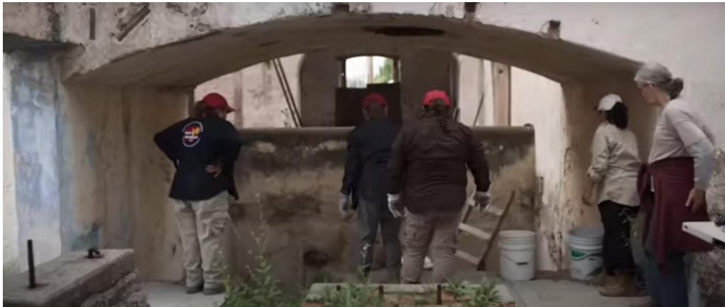
Figura 1. Fotograma de la película Ruido . Escena: Julia junto al grupo de madres buscadoras en una fosa clandestina.

Sin duda, en esta cinta la mujer madre se representa en sus distintas facetas. Por un lado, Julia es una madre fuerte y por otro, vulnerable. Sin embargo, es esta vulnerabilidad la que nos parece logra representar cómo el maternar se vive de manera más real y siempre condicionada al contexto específico de las mujeres que la ejercen. Por tanto, en Ruido , la representación de la maternidad deja ver la complejidad que significa el maternar en un país como es México y en donde Julia, como una más de las madres buscadoras, representa a las mujeres madres que cotidianamente se enfrentan a la violencia estructural que ejerce la necropolítica; no obstante, las mujeres con las que Julia busca a su hija, logran tener notoriedad en la película en tanto que a modo de un recurso documental, la cámara les otorga protagonismo. Las madres, que son mujeres reales, pertenecientes a los colectivos de buscadoras, hablan frente a la cámara sobre los seres queridos que buscan y ello funciona, en el contexto de la película,