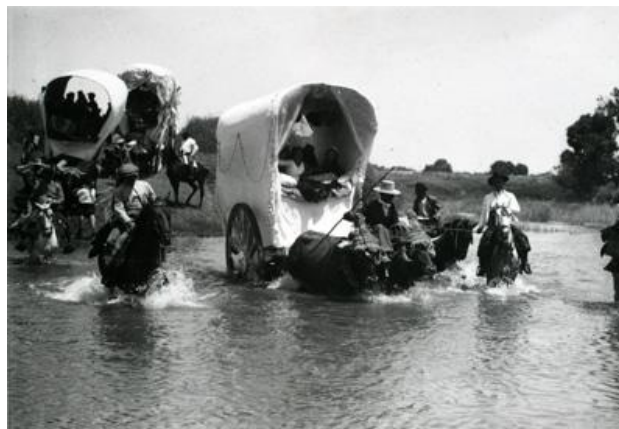
Carretas en la Romería del Rocío, 1928.

La colección de retratos es interesante, además de por los contenidos, por la diversidad de autores que la componen, ya que se encuentran representados los mejores fotógrafos del primer tercio del siglo XX, nombres vinculados a la historia de la imagen, como Amer, Calvache o Kaulak, cuyas colecciones se encuentran en la Biblioteca Nacional; Beringola, Biedma, Cartagena, Castillo, Franzen, Mendoza o Walken. Además de estos autores, hay obras de fotoperiodistas reputados como Alberro y Segovia, Barrera, Cervera, Compañy, Contreras, Díaz Casariego, Grollo, Pérez de Rozas o Ventura, y principalmente de los tres citados anteriormente: Serrano, Sánchez del Pando y Santos Yubero.