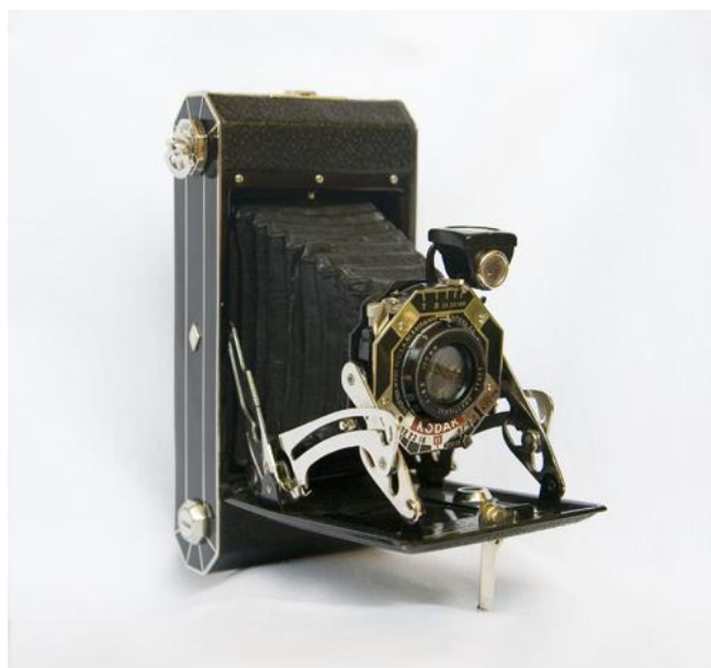
Cámara fotográfica de Joaquín Turina.

Joaquín Turina tuvo en su familia los modelos ideales para practicar la fotografía. Los reportajes son muchos y de gran valor testimonial. De los más de ochocientos retratos que se conservan en los álbumes, más de la mitad se los hizo a su esposa e hijos. Manejaba todos estos factores con pericia, sobre todo la luz, como se observa en los rostros perfectamente iluminados, incluso en los contraluces, sin sombras que difuminen los detalles. También se advierte un interés por mostrar el entorno del personaje, por encajar las figuras en el espacio, despreocupándose a veces de la persona o personas fotografiadas para dar sentido al conjunto.