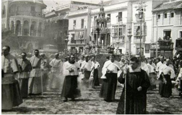
Procesión del Corpus en la plaza de San Francisco, 1933.

Reverso: Nº 151 Sello Eulogio de las Heras