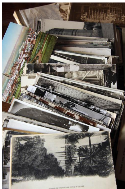
Tarjetas postales de la colección