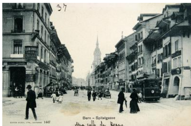
Suiza. Calle de Berna, 1905. Tarjeta postal nº 703 Caja 1