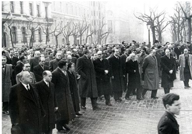
Entierro de Turina en Madrid, 15 de enero de 1949.

Caja 1 tarjetas con notas de Turina nº 1192,