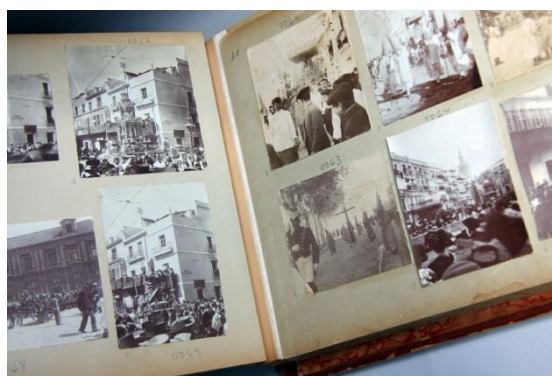
Álbum nº 1 de la colección