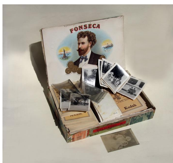
Caja de puros con originales fotográficos

Repasando la diversidad de documentos se observa su sensibilidad hacia la imagen, en especial por las tarjetas postales, donde la selección fue tan personal que del análisis se desprenden determinados gustos, incluso comportamientos. Como hemos indicado, los documentos se conservaban dentro de objetos que habitualmente se utilizan para las colecciones fotográficas de familia: cajas de cartón y metal, carpetas, sobres y álbumes de época. En primer lugar se establecieron tres grupos (cajas, fotografías sueltas y álbumes), se valoró el conjunto y se describieron los objetos y su contenido. Se llevaron a cabo dos expurgos, el primero para eliminar las tarjetas postales fuera de época, es decir las que no se corresponden con la vida de Turina (posteriores a 1949), y el segundo expurgo para retirar las fotografías repetidas en el conjunto de documentos sueltos en soporte papel.