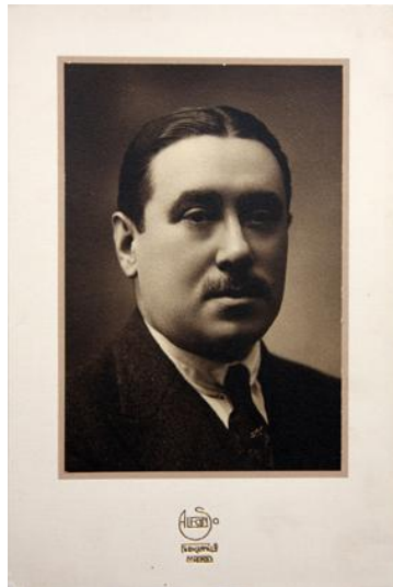
Joaquín Turina 14 de mayo de 1924.