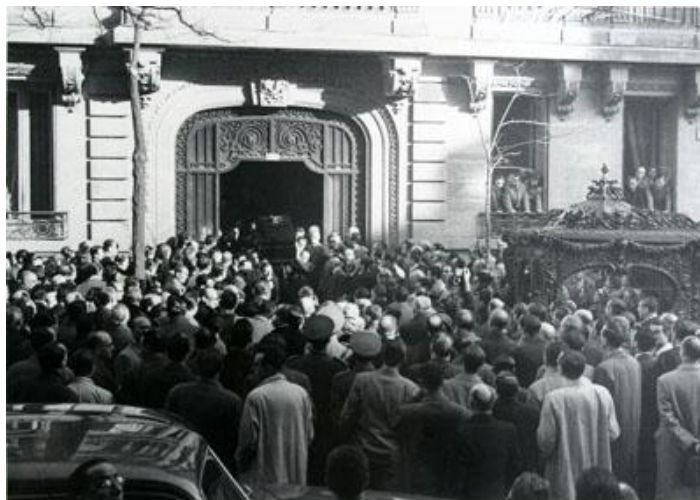
Funeral de Turina el 15 de enero de 1949.

Su última creación fue Desde mi terraza, el lugar donde se inspiró en numerosas ocasiones y al que le dedicó estas palabras en el artículo "El día de la inspiración", publicado en Dígame el 4 de julio de 1944: "Los días son claros, luminosos y con reflejos de sol que, como saetas, se clavan en los libros y los cuadros del despacho.... La brisa, templada y suave, trae aromas de flores de la cercana terraza". Turina falleció el 14 de enero del año 1949 en Madrid.