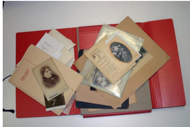
Carpeta con fotografías sueltas