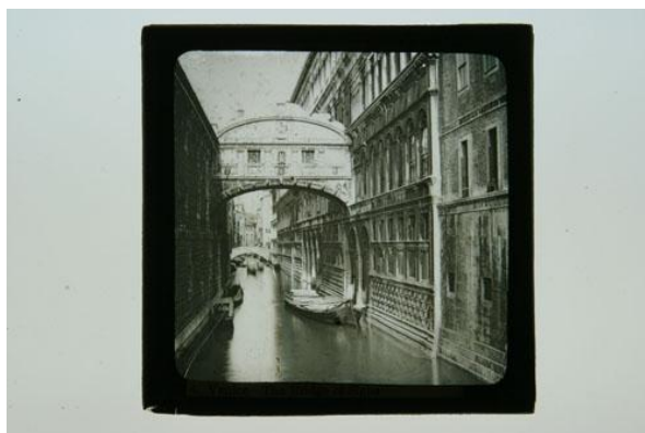
Venecia. Puente de los Suspiros, h. 1910.