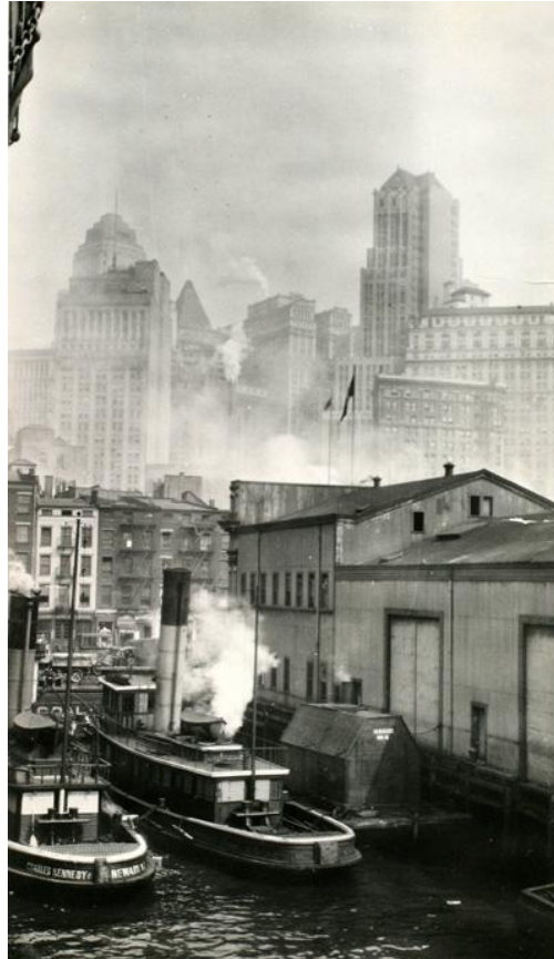
Puerto de Nueva York. La ciudad vista desde el barco Cristóbal Colón.

Abril de 1929. Fotografía de Joaquín Turina