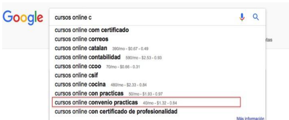
Figura 4. Ejemplo de autocompletado con la palabra clave “cursos online C”. Se puede observar el número de búsquedas mensuales y su coste por clic. En rojo hemos seleccionado una palabra clave que podemos incorporar en el texto para enriquecerlo semánticamente.

A continuación contamos con la herramienta gratuita Isigraph.com . Es un programa que nos devuelve palabras clave que podremos utilizar para mejorar nuestro LSI.