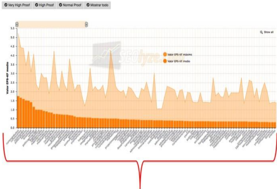
Figura 8. Gráfica con las palabras que se usan para posicionar “cursos online” en base a una tres palabras.

La gráfica nos muestra varios elementos adicionales: