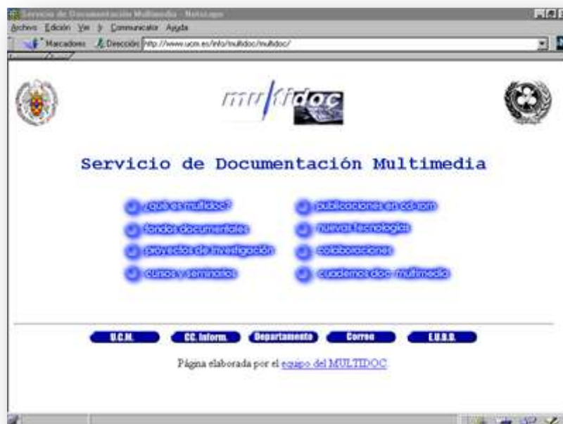
Lista de distribución electrónica sobre Documentación y nuevas tecnologías en el cine español (CINEDOC) (1998).