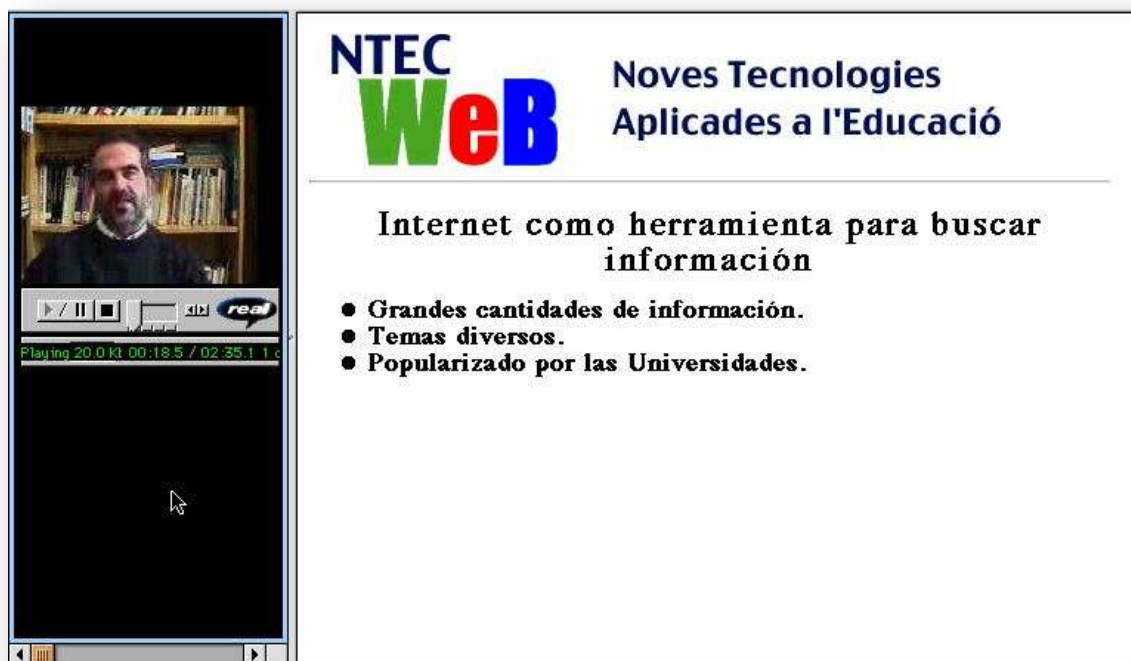
Fig. 4: Ejemplo de un documento de video "on-demand"