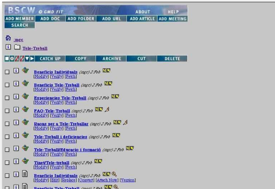
Fig. 3: Ejemplo del resultado

de un proceso de búsqueda de información en la red integrada en el entorno de trabajo.