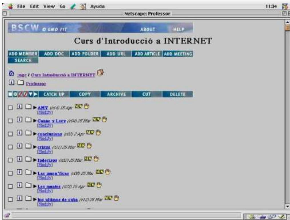
Fig. 2: Ejemplo de uso del entorno de trabajo