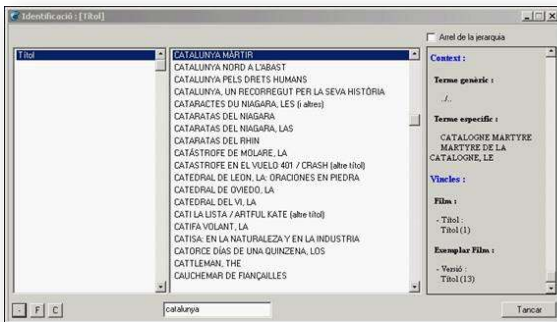
Fig. 7: vínculos desde el diccionario de títulos. A la derecha las relaciones jerárquicas y las fichas Film y ejemplar Film enlazadas.

Otra de las ventajas de los campos diccionario es la posibilidad de recuperar al instante las fichas con los valores seleccionados.