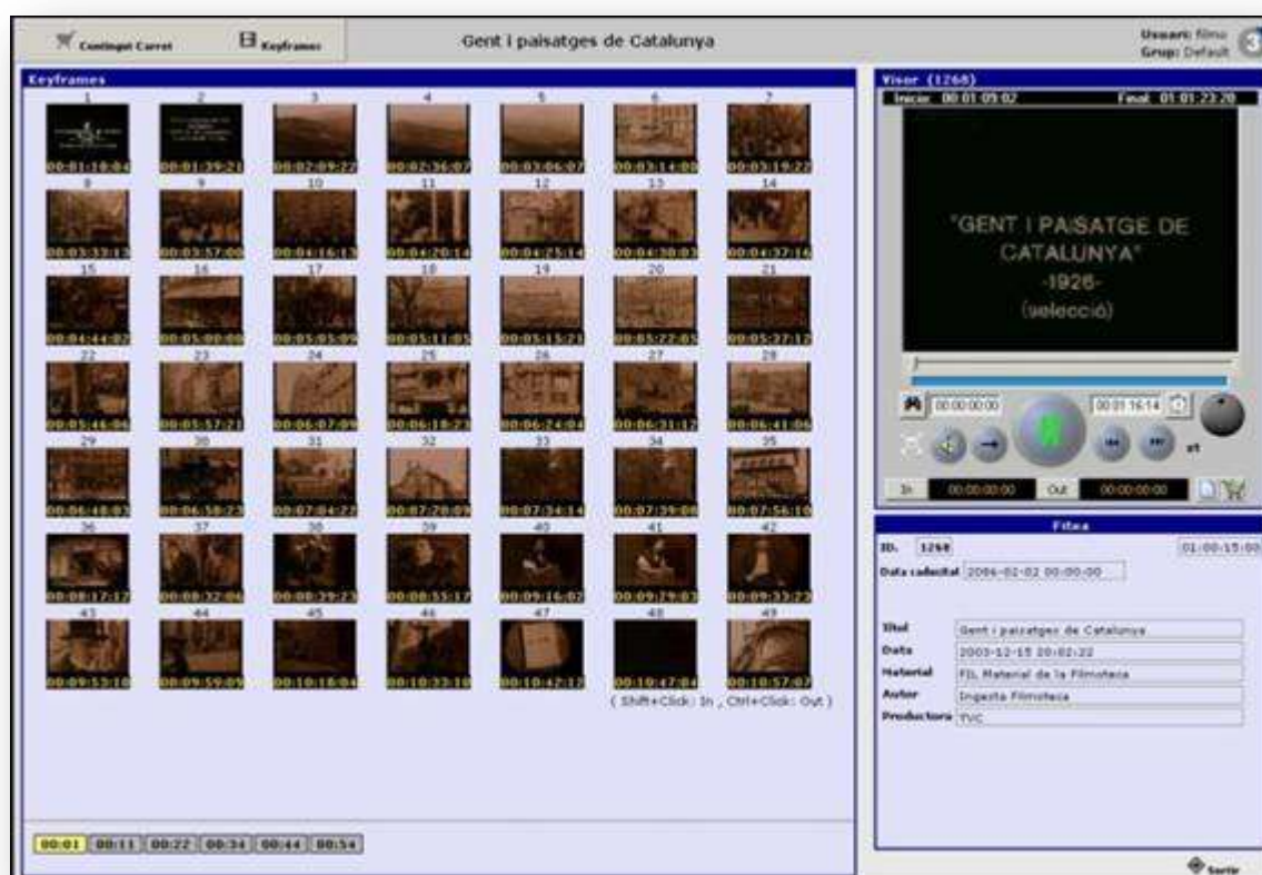
Fig. 9: Digion permite una visualización en baja resolución, búsqueda mediante keyframes.

El visionado es gratuito en nuestras instalaciones, actualmente la única vía de acceso.