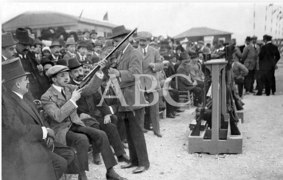
Fig. 5. Alfonso XIII en el tiro de pichón en Alicante, 1911

En cuanto a las fechas, las tres imágenes no siguen la norma internacional, es decir año, mes y día, sino que se hace a la inversa. En cuanto al tema de la autoría de la imagen, en el primer caso se indica “Sin firma” mientras que en el resto se indica nombre y apellido (Ramón Alba y Martín, Norton) y no apellido y nombre, como es la norma internacional.