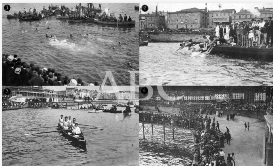
Fig. 6. Fiestas Náuticas en San Sebastián en 1918

En cuanto a las fechas, las tres imágenes no siguen la norma internacional, es decir año, mes y día, sino que se hace a la inversa. En cuanto al tema de la autoría de la imagen, en el primer caso se indica “Sin firma” mientras que en el resto se indica nombre y apellido (Ramón Alba y Martín, Norton) y no apellido y nombre, como es la norma internacional.