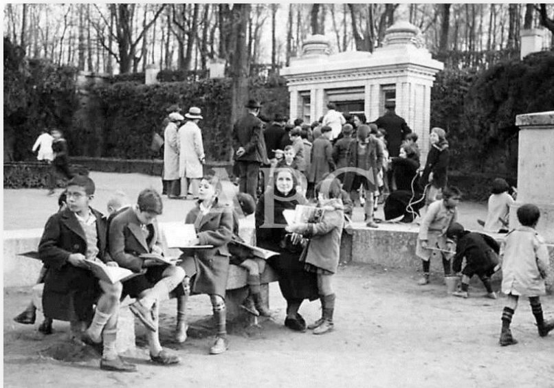
Fig. 4. Biblioteca infantil en el Retiro, 1929

En el caso del término “Biblioteca” se indica que es una Biblioteca Infantil y se añade más información “Como moscas a la miel, así acuden los pequeños a su biblioteca, grupo de bibliófilos en la claridad otoñal”. En el término biográfico la descripción es más breve “El viaje del Rey a Alicante, S. M. son Alfonso XIII en el tiro de pichón examinando una escopeta.