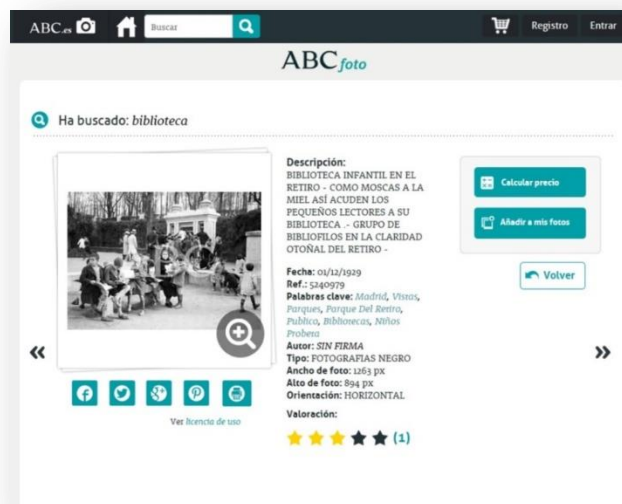
Fig. 3. Documentación de la imagen

El otro elemento es Palabra clave, término por el que se recupera la imagen y se accede a las fotografías. Se incluyen descriptores geográficos, es decir nombres de ciudades o lugares (como se puede comprobar en la Figura.3), así como términos generales que se ven en la imagen.