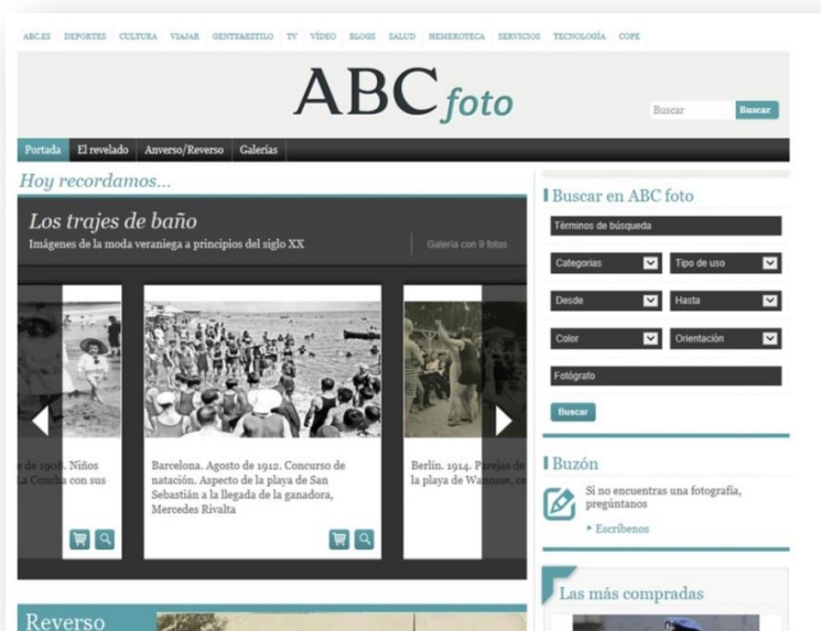
Fig. 1. Página principal de Abcfoto

La página es muy visual, los datos fáciles de localizar y la consulta sencilla, con la posibilidad de adquirir imágenes que hayan sido publicadas en el periódico impreso o en el digital. Dispone de buscador con dos opciones: general o avanzada, y cuatro apartados: 1. Categorías, 2. Tipos de uso de la imagen (solo para visionarla o descargarla), 3. Fecha (extremas desde 1850 hasta 2014), 4. Color (blanco y negro o color), 5. Orientación (vertical u horizontal) y 6. Fotógrafo.