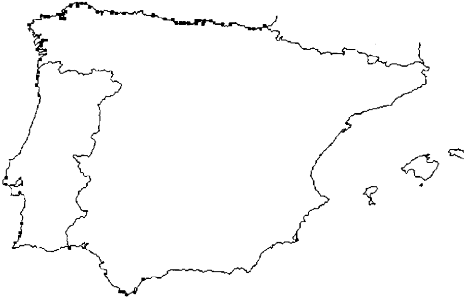
Mapa 15: Distribución de Fucus spiralis L. ar. spiralis en la Península Ibérica.

Map 15: Distribution of Fucus spiralis L. var. spiralis in the Iberian Peninsula.