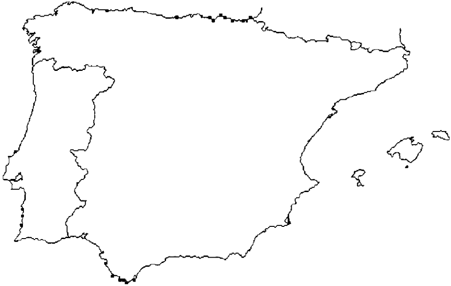
Mapa 16: Distribución de Fucus spiralis L. var. limitaneus en la Península Ibérica.

Map 16: Distribution of Fucus spiralis L. var. limitaneus in the Iberian Peninsula.