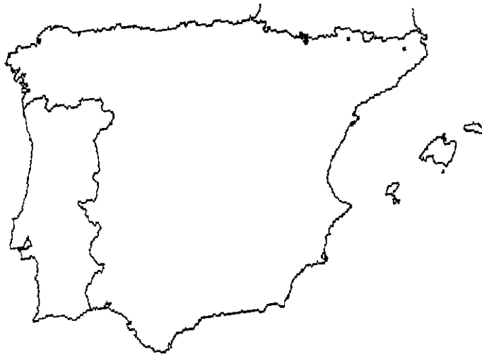
Mapa 3.—Distribución de Peltigera lepidophora (Vain.) Bitter Map 3.—Distribution of Peltigera lepidophora (Vain.) Bitter

ANDORRA: "Les Escaldes-Engordany, bajando del collado de Jovell", 31TCH80 , 1650 m, sobre talud rocoso de granito, Herrero , 6-XII-1994, HIMM 341.