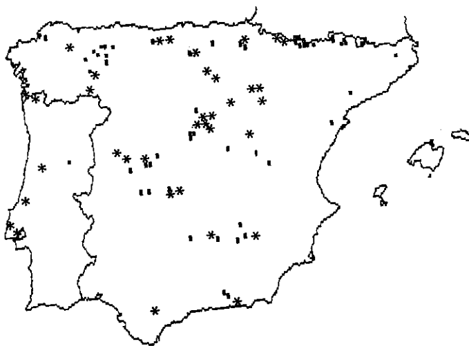
Mapa 7.-Distribución de Peltigera praetextata (Flörke ex Sommerf.) Zopf Map 7.-Distribution of Peltigera praetextata (Flörke ex Sommerf.) Zopf

SORIA: "Villaciervos", 30TWM32 , 1000 m, encinar, Ahti & Burgaz , 10-IX-1991, MACB 44593.