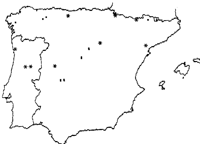
Mapa 2.—Distribución de Peltigera didactyla (With.) J.R. Laundon Map 2.—Distribution of Peltigera didactyla (With.) J.R. Laundon

BEIRA ALTA: "Sierra de la Estrela", 29TPE27 , 1100 m, sobre roca ácida, abedular, Martínez et al. , 31-V-1993, HIMM 394.