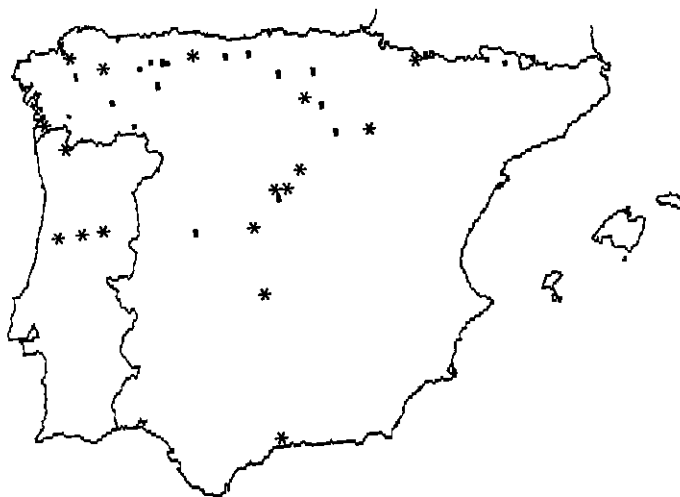
Mapa 5.—Distribución de Peltigera membranacea (Ach.) Nyl.