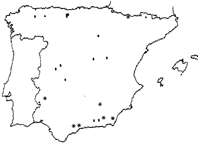
Mapa 6.—Distribución de Peltigera ponojensis Gyeln.

BEIRA LITORAL : “Luso, Sierra de Bussaco”, 29TNE56 , 500 m, sobre suelo, en robledal de Quercus robur , Martínez et al., 1-VI-1993, HIMM 426. BEIRA ALTA : “Sierra de la Estrela”, 29TPE27 , 1100 m, sobre roca ácida, abedular, Martínez et al., 31-V-1993, HIMM 429.