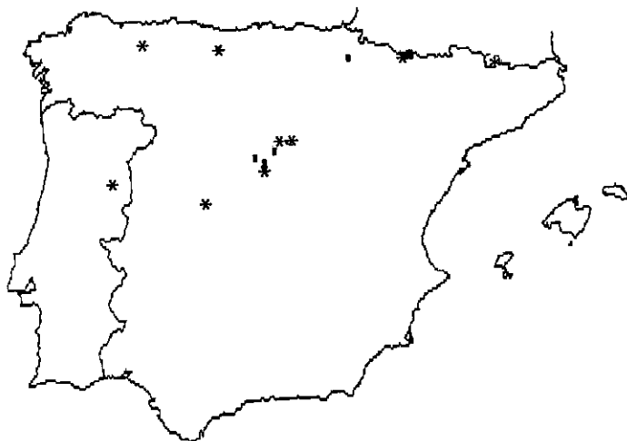
Mapa 4.-Distribución de Peltigera malacea (Ach.) Funck Map 4.-Distribution of Peltigera malacea (Ach.) Funck

LÉRIDA: "Espot, Estany d'Amitges", 31TCH3418 , 2400 m, sobre granitos, prados de montaña, Martínez et al. , 6-VII-1994, HIMM 177.