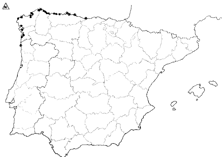
Mapa 7: Distribución de Fucus serratus L. (●) UTM justificada mediante cita de pliego; (*) UTM basada exclusivamente en cita bibliográfica.

Map 6: Distribution of Fucus ceranoides L. (●) UTM justified by sheets.; (*) UTM justified only by bibliographical records.