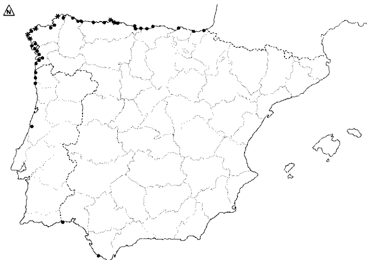
Mapa 6: Distribución de Fucus ceranoides L. (●) UTM justificada mediante cita de pliego; (*) UTM basada exclusivamente en cita bibliográfica.

Map 6: Distribution of Fucus ceranoides L. (●) UTM justified by sheets.; (*) UTM justified only by bibliographical records.