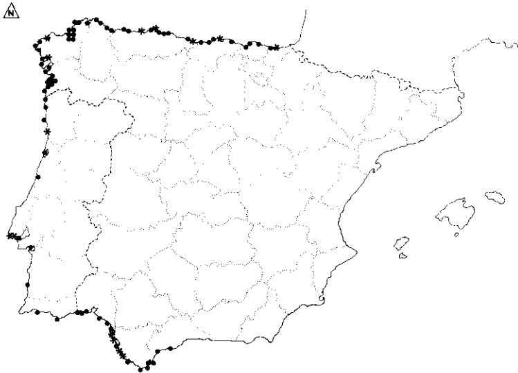
Mapa 8: Distribución de Fucus spiralis L. (●) UTM justificada mediante cita de pliego; (*) UTM basada exclusivamente en cita bibliográfica.

Map 8: Distribution of Fucus spiralis L. (●) UTM justified by sheets; (*) UTM justified only by bibliographical records.