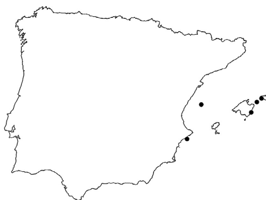
Mapa 2- Distribución de Cryptonemia tuniformis en la Península Ibérica y las islas Baleares.

CASTELLÓN DE LA PLANA: 31SCE01 , illes Columbrets, -25/29 m, VII-1978, VAL-Algae 886-1.