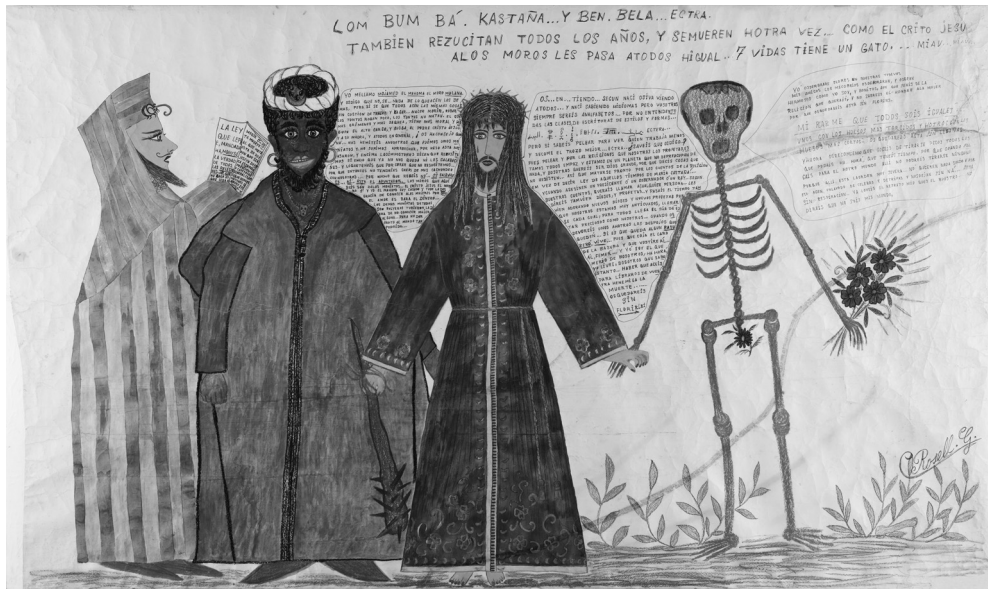
Autora anónima, 1976.