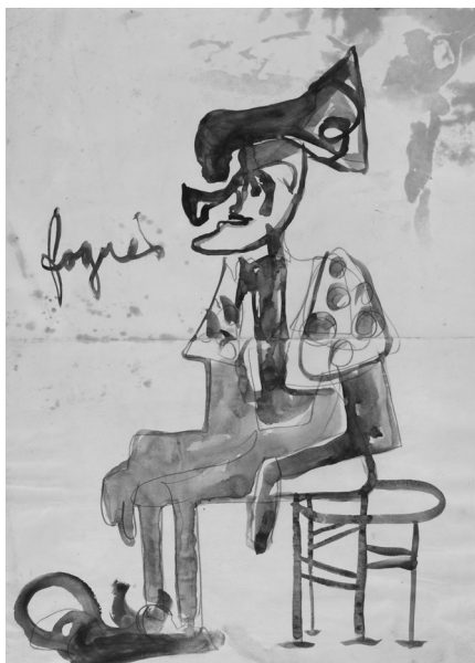
C. Rajel (1960) H.P.Menni, Ciempozuelos.

Las láminas que presentamos en esta sección no dejan lugar a dudas en relación a estas notas que apuntamos sobre la situación de los manicomios en nuestro país.