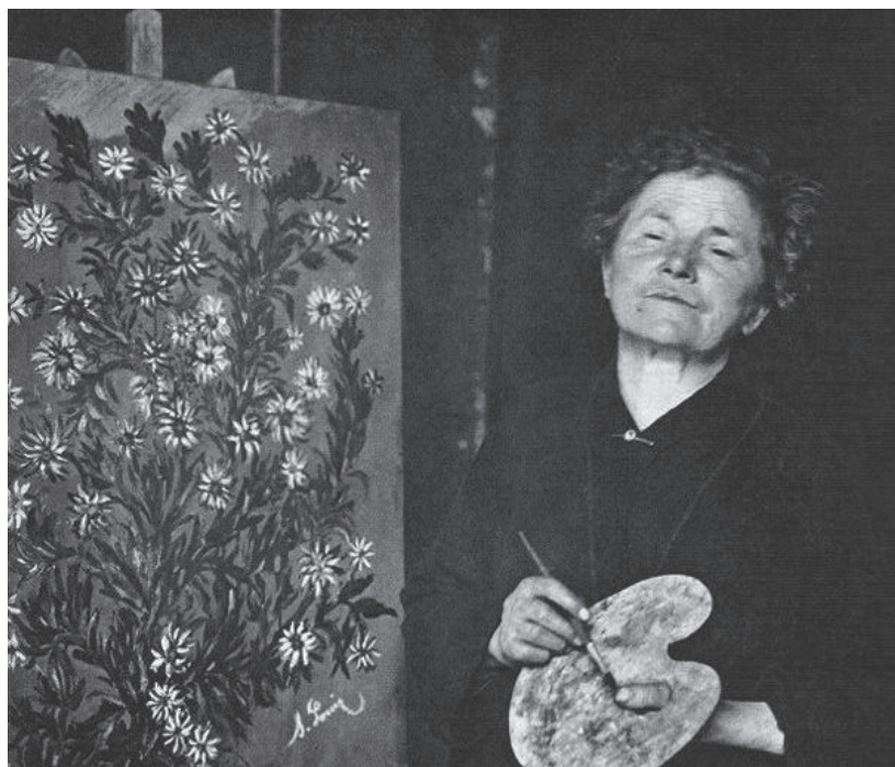
Imagen 3: Séraphine Louis. Retrato junto a una de sus obras.