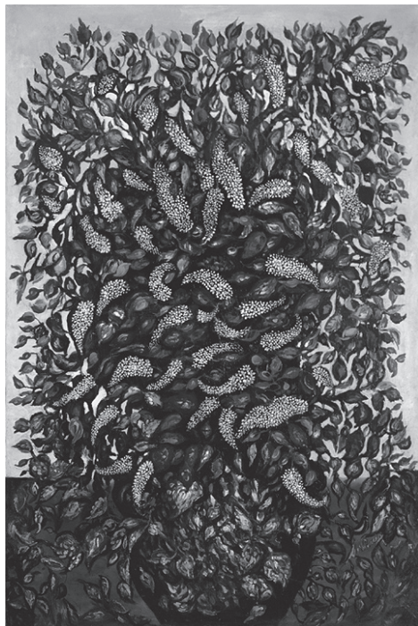
Imagen 2: Séraphine Louis. « Flores y frutas » (1920) © Adagp, Paris 2008 Collection