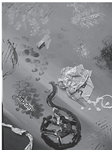
Lucía (2006): "Burbujas suicidas"

La apreciación y utilización del color es una fuente de profundización en el auto conocimiento y en el