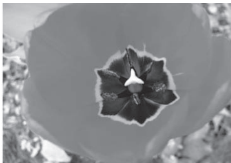
K. Rigo (2006) "Geometría y color 1"