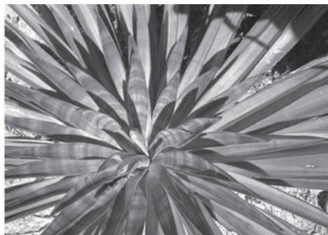
K. Rigo (2006) "Geometría y color 2"

Sabemos que la creación artística no sólo es un acto de expresión de un sentimiento, también supone una vía para la motivación, una manera de trabajar la sensibilización, un camino para la adquisición de nuevos conocimientos y actitudes, y también una forma de comunicación.