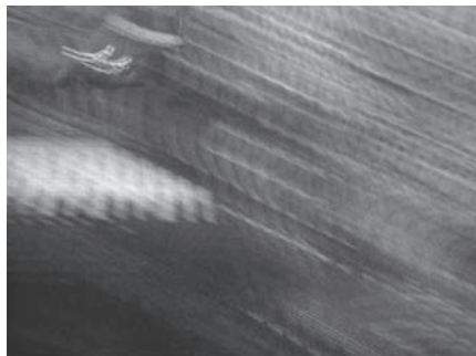
(Fotografías detalle de baile-ofrenda)