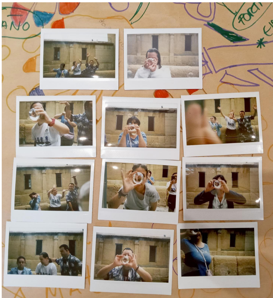
Figura 1. Fotografías instantáneas performativas con personas con síndrome de Down.