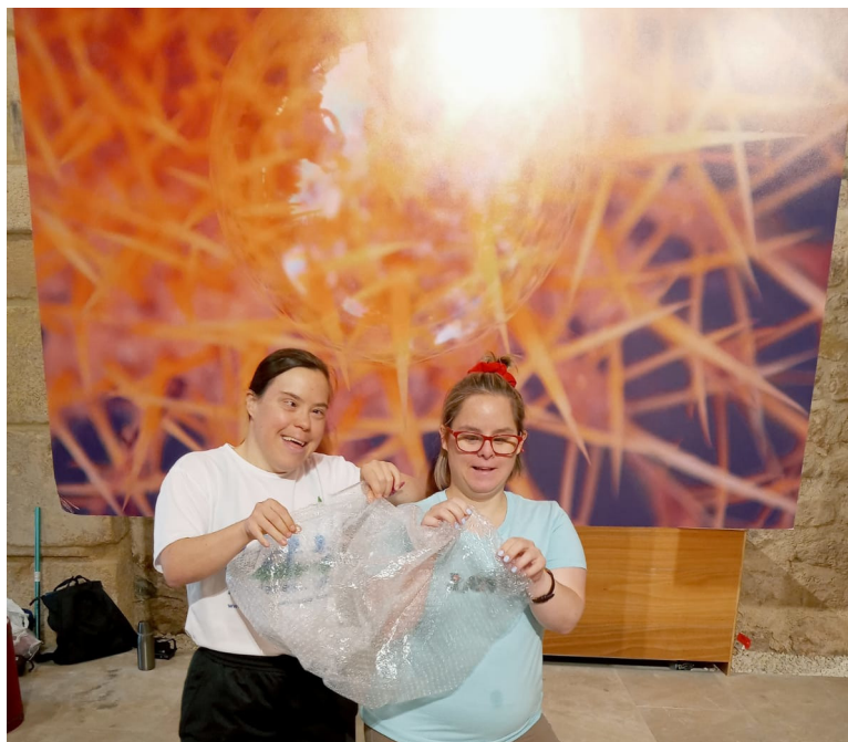
Figura 3. Participantes del taller experimentando con el papel de burbujas de manera performativa y colaborativa.

La utilización de papel de burbujas en este contexto, más allá de su función protectora en el embalaje de objetos frágiles, abre una vía hacia la creación artística que invita a los cocreadores a explorar los potenciales sonoros del material de forma intuitiva y performativa (Figura 3). La acción de explotar las burbujas, con su sonido característico, se convierte en un proceso de improvisación sonora donde el ritmo y la intensidad se modulan en función de las decisiones y movimientos individuales, generando una especie de “concierto” improvisado o de performance sonora. Este ejercicio refleja una escucha activa y profunda, un principio clave tanto en la práctica del mindfulness como en el ASMR, donde la atención a los detalles sensoriales se convierte en un vehículo para el bienestar emocional (Reddy y Mohabbat, 2020).