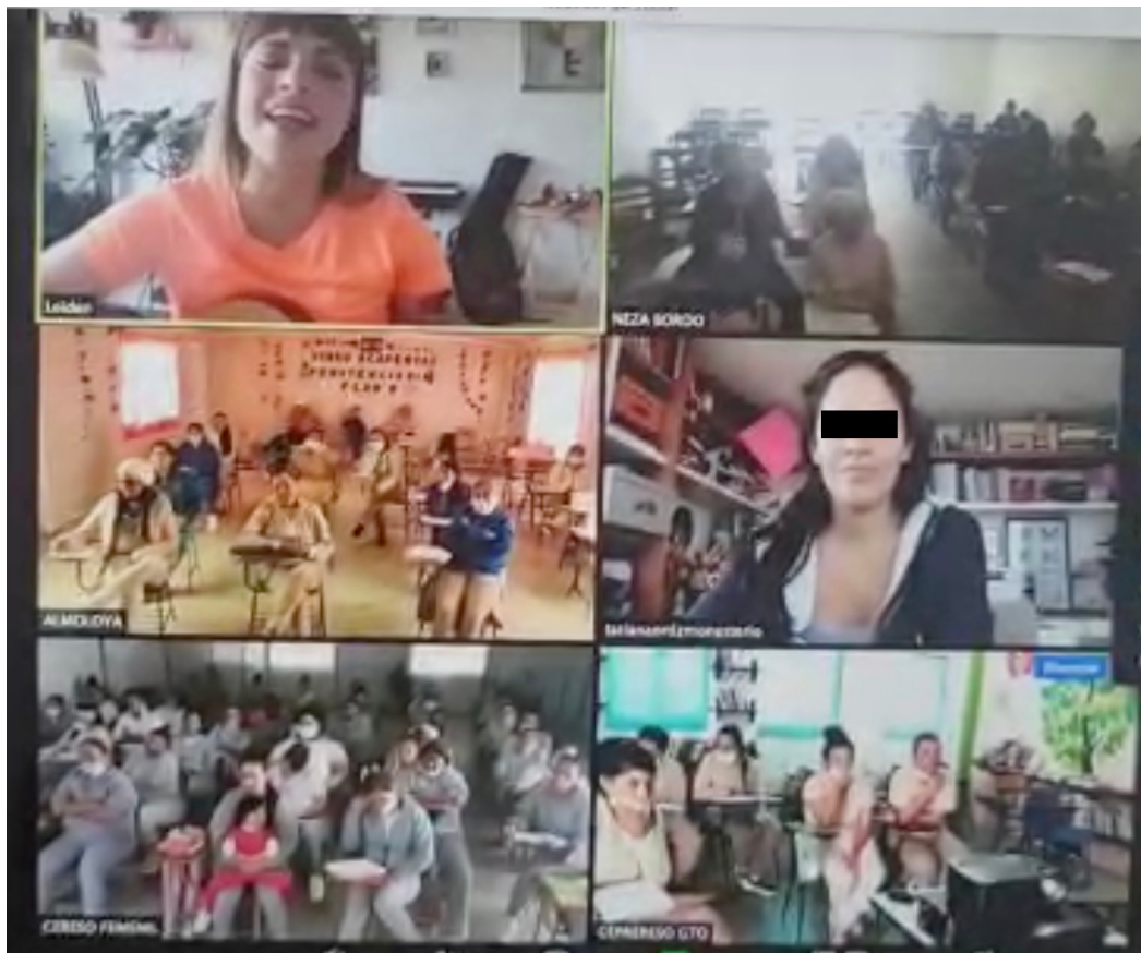
Fotografía 5. Fase 2: las mujeres escuchan las músicas con que se interpretaron sus canciones y expresan su conformidad con ella