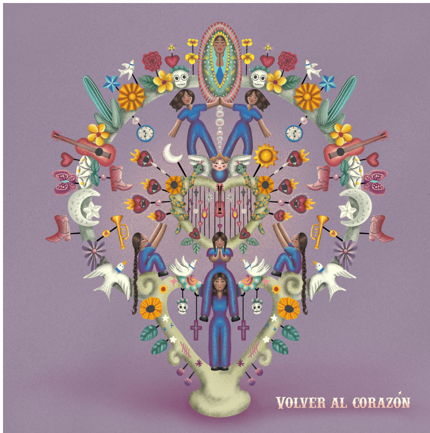
Fotografía 6. Carátula del disco Volver al corazón : un árbol de la vida, con palomas de esperanza entre instrumentos musicales, y mujeres vestidas con su uniforme carcelario