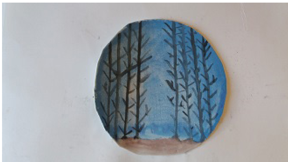
El claro del bosque. Obra producida por una paciente mujer en la consulta privada

El taller de arteterapia para mujeres ofrece un lugar para despejar el bosque de miradas ajenas y de juicios más o menos asentados en nuestro superyó.