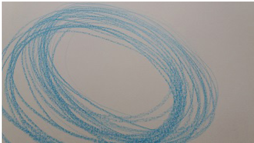
Movimiento Centrífugo. Obra procedente de un taller de arteterapia para mujeres realizada por una mujer joven

El mismo autor nos habla de que fallas importantes en este ambiente primigenio de desarrollo pueden dar lugar a traumas más o menos graves e impedir la expresión de lo que él llamará el verdadero self , ese que se mueve de dentro hacia fuera, creando y hallando el mundo desde sí, en pos de la existencia de un falso self , que se basa en lo de fuera para moverse, que se mueve centrípedamente, y se encuentra, en definitiva, al servicio de proteger al verdadero self . La función defensiva de este falso self se organiza en torno a la disociación de las propias necesidades.