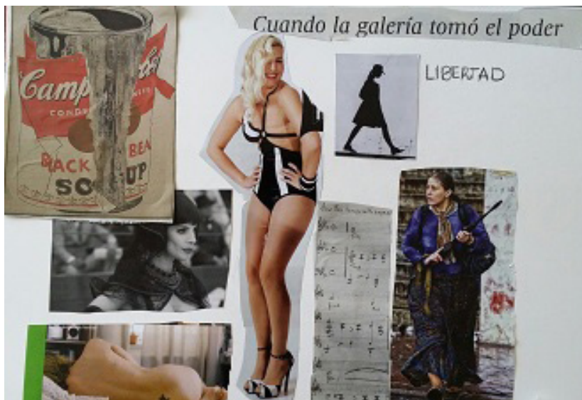
Diferentes personajes. Obra producida por una paciente mujer en la consulta privada)

O en una serie de personajes internos antagónicos y desacordes pero que a través del arteterapia pueden ponerse al menos a dialogar.