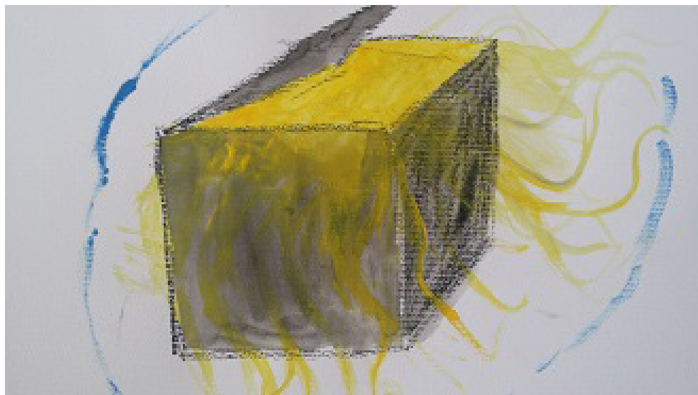
Las cajas. Obra producida por una paciente mujer en la consulta privada

A veces la injerencia y la invasión externa se sienten de tal forma, que la persona necesita hacer uso de sus cajas, para proteger su espacio propio. Al principio de su terapia, solo desde el espacio cerrado de las cajas, podía esta paciente relacionarse, pedir, suplicar, desbordarse, sin el miedo que le daría estar totalmente expuesta.