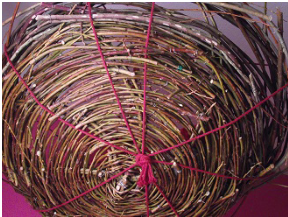
El nido. Obra propia

Porque el espacio propio es también ese nido en el que finalmente nos podemos sentar a incubar, en el que después de dar muchas vueltas y caminar, a veces pareciera que, en sentido errático, una puede pararse y escribir, pintar, bailar, fotografiar.