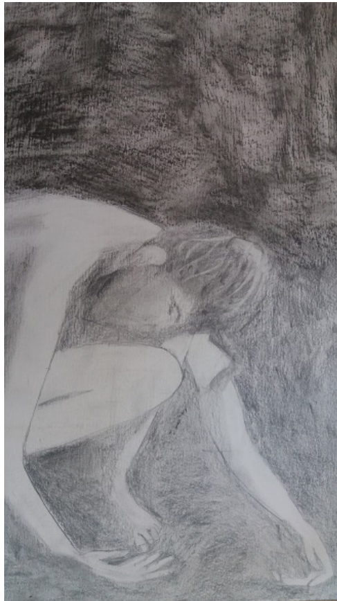
Cuerpo rendido. Obra propia

Desde el acompañamiento arte terapéutico a veces habrá que colocar almohadas alrededor de un bebé que duerme plácidamente en el centro de la cama. Porque el espacio propio también es un lugar donde poder dejarse caer, donde poder derrumbarse y soltar el peso de la culpa. Otras veces quizá haya que poner un poco de luz para que la persona pueda alumbrar en compañía algunos de sus monstruos.