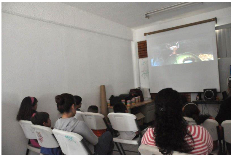
Foto 2. Actividad de proyección en cinematerapia

en: facilitar la toma de conciencia de los beneficios personales y comunitarios de conectarse con la naturaleza; estimular el desarrollo de capacidades creativas, y canalizarlo hacia la búsqueda del auto-cuidado, la armonía interior y la comunicación saludable, en estrecha relación con la apreciación del entorno y su preservación.