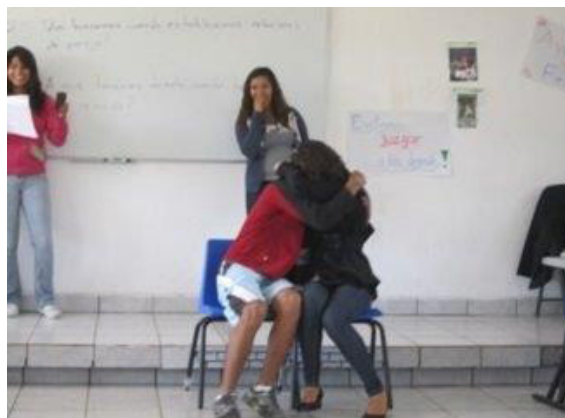
Fotos 4 y 5. Grupos de jóvenes en actividades de sociodrama.