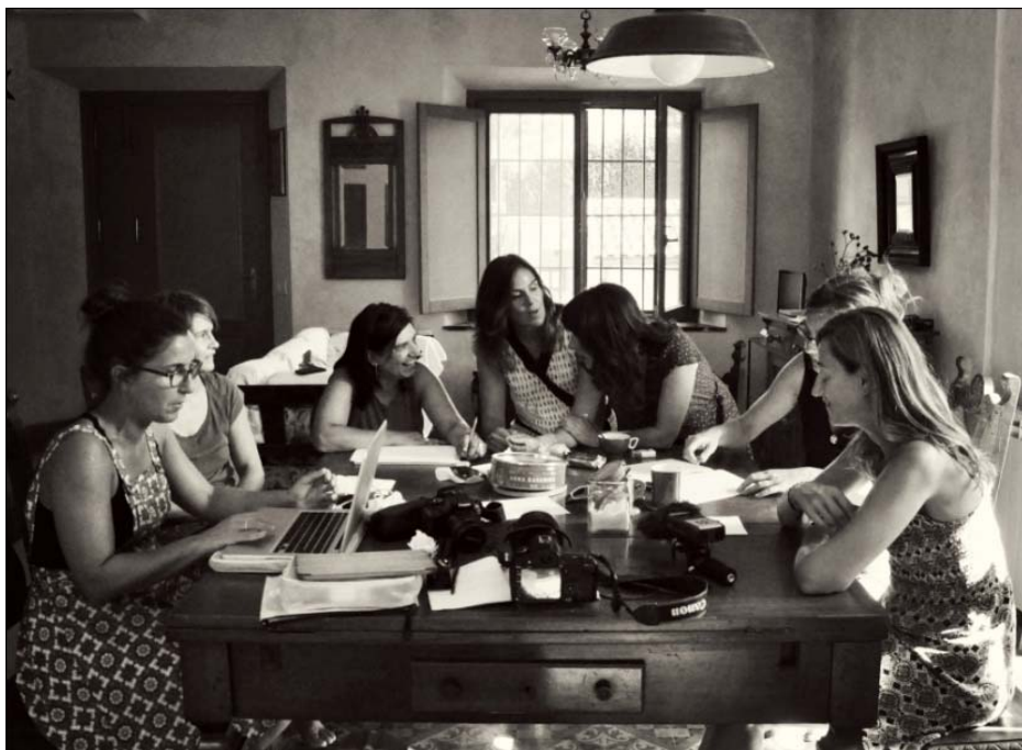
Figura 10. Colectivo Offmothers. 2016.