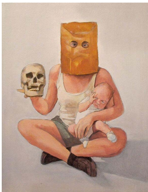
Figura 2. Cristina Llanos. El pacto secreto. 2015.