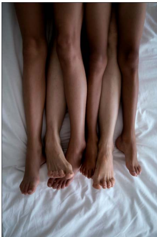
Figura 5. Natalia Iguñiz Boggio. Pequeñas historias de la maternidad 3 . 2015