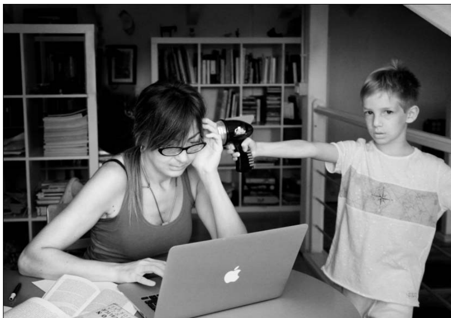
Figura 11. Colectivo Offmothers. 2016.