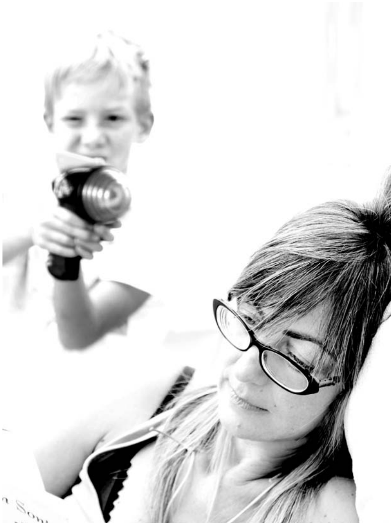
Figura 12. Colectivo Offmothers. 2016.

"Te odio por no hacer lo que yo quiero que hagas, por no irte a la cama para que yo pueda tener tiempo para mí, por no dejarme dormir, te odio por no poder hacer todas las cosas que haría si tú no existieses". Lesley Saunders: Catálogo maternal.