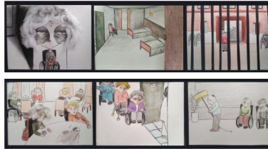
Figura 4. Fotogramas representativos de la animación.

La animación, con una duración total de seis minutos, reconstruye los testimonios de las participantes (n=12 en total, 11 mujeres y 1 hombre) sobre su experiencia de vivir en un entorno institucionalizado mediante escenas de stop motion (Fig. 4). La narrativa visual intenta representar y transmitir la percepción de un tiempo suspendido, la presencia constante de la soledad y la tristeza y el sentimiento de pérdida de autonomía. Asimismo, incorpora situaciones observadas en la residencia tales como personas deambulando con la mirada perdida, residentes inmóviles en sillas de ruedas o personas pidiendo ayuda para ir al aseo sin obtener respuesta inmediata.