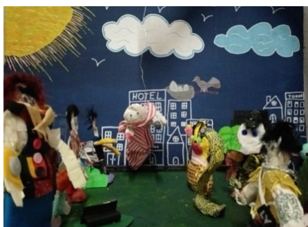
Figura 2. Personaje de creación colectiva.

La animación finaliza con todos los personajes formando un círculo en el centro del escenario, abriendo la posibilidad para un gesto de cierre y contención grupal, remitiendo a la idea de unidad, protección y pertenencia, sugiriendo una cohesión momentánea del grupo tras haber atravesado la experiencia de amenaza y la resolución necesaria. Desde una perspectiva arteterapéutica, esta secuencia final aparece como la construcción de un espacio simbólico donde es posible reorganizar la experiencia, integrando el conflicto dentro de una narrativa compartida que no solo da cuenta del peligro, sino también de los recursos —individuales y colectivos— para hacerle frente.