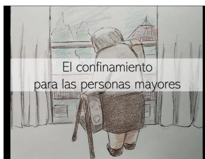
Figura 5. Cartel de la animación “El confinamiento para las personas mayores.” Enlace de visualización: https://youtu.be/4QnklQF07Os?si=9c75EU97JiI2haW

En nuestro caso, la animación se ha ido adaptando a las circunstancias que se presentaban para poder cumplir con su objetivo y llegar al máximo número de personas posible. Inicialmente, Una vida...Un bolso fue presentada en el Festival de Derechos Humanos HumanFest Valencia (2020). Posteriormente, esta animación fue adaptada para el festival DocuVir.20 bajo el título El confinamiento para las personas mayores , incorporando nuevas imágenes para visibilizar el aislamiento vivido por este grupo durante la pandemia (Fig. 5). Este festival se realizó de manera virtual debido a las restricciones sanitarias, lo que permitió ampliar su alcance y haber podido generar un impacto significativo en la concienciación pública sobre la realidad de las personas mayores.