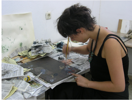
Figura 6. Retoques antes de la estampación

La utilización de papeles reciclados para la estampación se integra como actividad de concienciación del problema de la sobreexplotación, el descenso de la masa forestal y como consecuencia el cambio climático. El alumno podrá elaborar sus propios papeles o reutilizar los ya usados. También se realizará una serie de aclaraciones sobre aquellos papeles que, por su absorbencia y porosidad, resultan adecuados para la estampación centrandó la explicación en la importancia de la humectación correcta del papel.