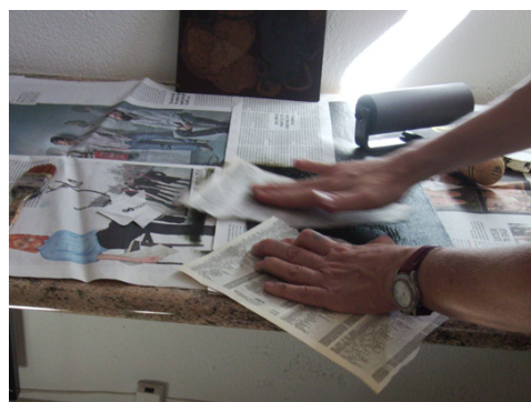
Figura 4 (Izq) Entintado de la plancha. Figura 5 (Dcha) Limpieza de la plancha

La estampación deberá realizarse con un tórculo sobreponiendo goma espuma entre los cilindros y las mantillas para evitar mellas en el papel y marcas en los cilindros. Los efectos de entintado y la manipulación en el proceso de estampación proporcionarán multitud de resultados que facilitarán el desarrollo del pensamiento y el entendimiento. Es posible la estampación a color utilizando los diferentes recursos de la estampación policroma tradicional como la estampación en hueco a la poupée, la estampación simultánea en hueco y en relieve, la estampación policroma sucesiva con una sola plancha (método Lasansky), la estampación con plancha puzzle (método Munch-Derain), la realización de pochoirs con plexiglás o estarcidos con acetatos finos, la estampación con una, dos o más planchas por sobreimpresión, pero quizás, por su dificultad y por tratarse de un primer acercamiento a las técnicas de grabado y estampación, se aconseja que en estos niveles se practique la estampación monocromática e incluso la estampación en seco valorando los resultados del gofrado.