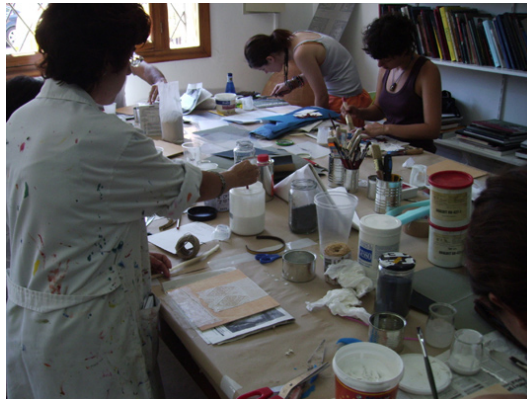
Figura 1. Creación de matrices

Otros componentes fundamentales a tener en cuenta a la hora de crear un collagraph son los adhesivos. Normalmente se utilizan emulsiones polimerizadas de resinas sintéticas, tales como las resinas acrílicas, látex, Liquitex, Tlyplar, Aquatec, entre otras. Atendiendo a su estructura deben ser termoplásticos y termoendurecibles, flexibles y de gran dureza para soportar la presión del tórculo. Los adhesivos seleccionados ofrecen un endurecimiento relativamente rápido, son poco contaminantes y no ocasionan toxicidad por lo que son considerados aptos para la utilización de los alumnos. También podemos incluir como adhesivos la masilla plástica y el gesso acrílico que tienen un alto poder pictórico y creativo destacando el potencial gráfico que ofrece la pasta para modelar. Se tendrá que tener en cuenta que si se quiere incorporar talla se deberá aplicar una capa ligera de barniz plástico para cerrar los poros y hacer menos absorbente la superficie para la tinta. Otro detalle imprescindible es el biselado de la plancha con una lija montada sobre un taco de madera para facilitar la limpieza a la hora del entintado, evitar dobleces en el papel en el momento de estampar y roturas en las mantillas del tórculo por un exceso de presión.