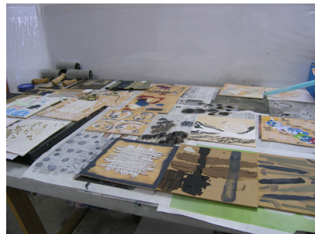
Figura 2 y 3. Secado y fijación de materiales reciclados