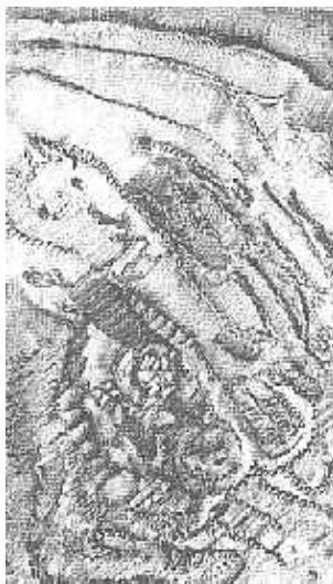
Michaux, pintura mescalínica, 1957. Oleo sobre tela. 33 x 19 cm.

Más débil aún, la mescalina hace ondular todas las cosas [...]» 12