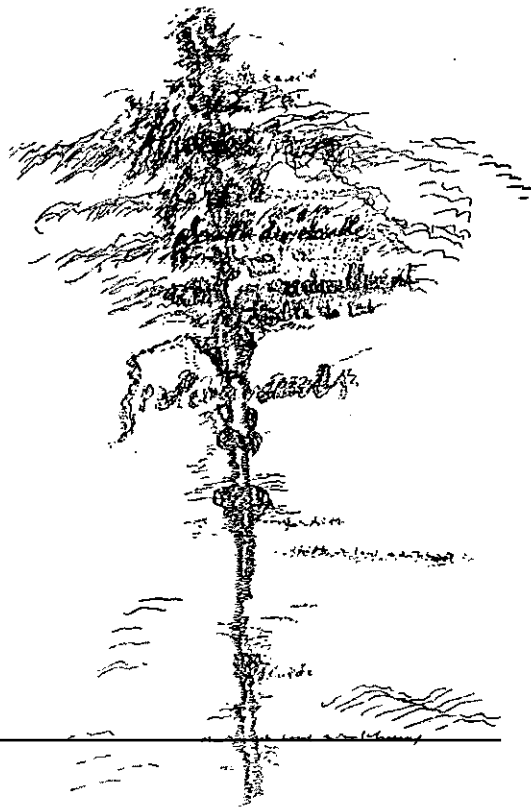
Michaux, dibujo mescalínico, c. 1956-1958. Tinta sobre papel. 21 x 17 cm.

«[...] los encabalgamientos, fenómeno siempre presente en la Mescalina [...]. Las dificultades insuperables proceden de la inaudita velocidad de aparición, transformación, desaparición de las visiones; de la multiplicidad, del pulular en cada visión; de los desarrollos en abanico o en umbela, en progresiones autónomas, independientes, simultáneas (de algún modo en siete pantallas); de su género inemocional; [...] ráfagas de imágenes, ráfagas de «síes» y de «noes», ráfagas de movimientos estereotipados.» 10