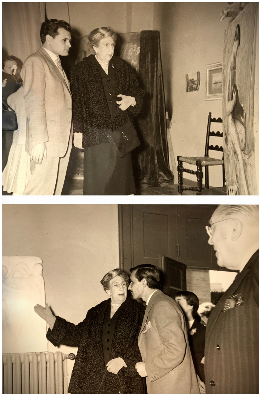
Figura 6. Visita de Victoria Eugenia a la Academia de España en Roma, 1956