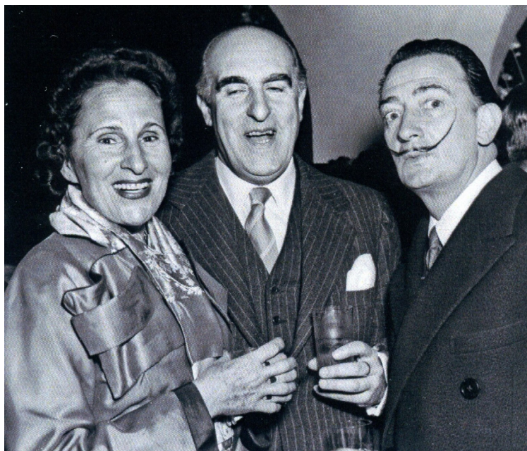
Figura 2. Vaquero acompañado de Dalí y Gala en Roma, 1952 (Publicada por primera vez en Gómez, 1974, p. 208; y posteriormente en Egaña, 2008, p. 1995 y en Egaña y Montes, 2013. 3 )

Nada tenían que ver, por tanto, estas buenas sensaciones que manifestaba el Director con lo visto en los primeros compases del presente escrito, donde preocupaba, precisamente, esa falta de integración de los pensionados en la vida artística y cultural de Roma. Así, con esa transición entre el antiguo y el nuevo régimen encarnado en las figuras de Vaquero y el Marqués de Lozoya, se empezaba a destacar en el mapa cultural romano, e incluso italiano, el trabajo de los creadores españoles.