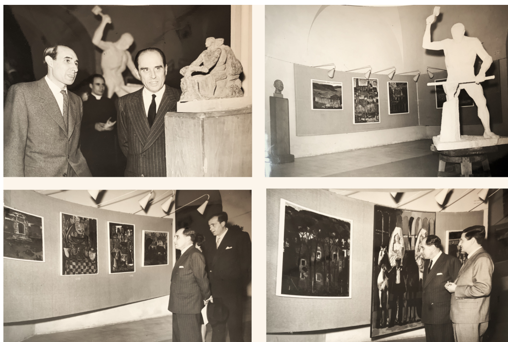
Figura 3. Inauguración de la muestra de los pensionados de la Academia de España en Roma en el Palacio de Exposiciones de la capital italiana, 1958