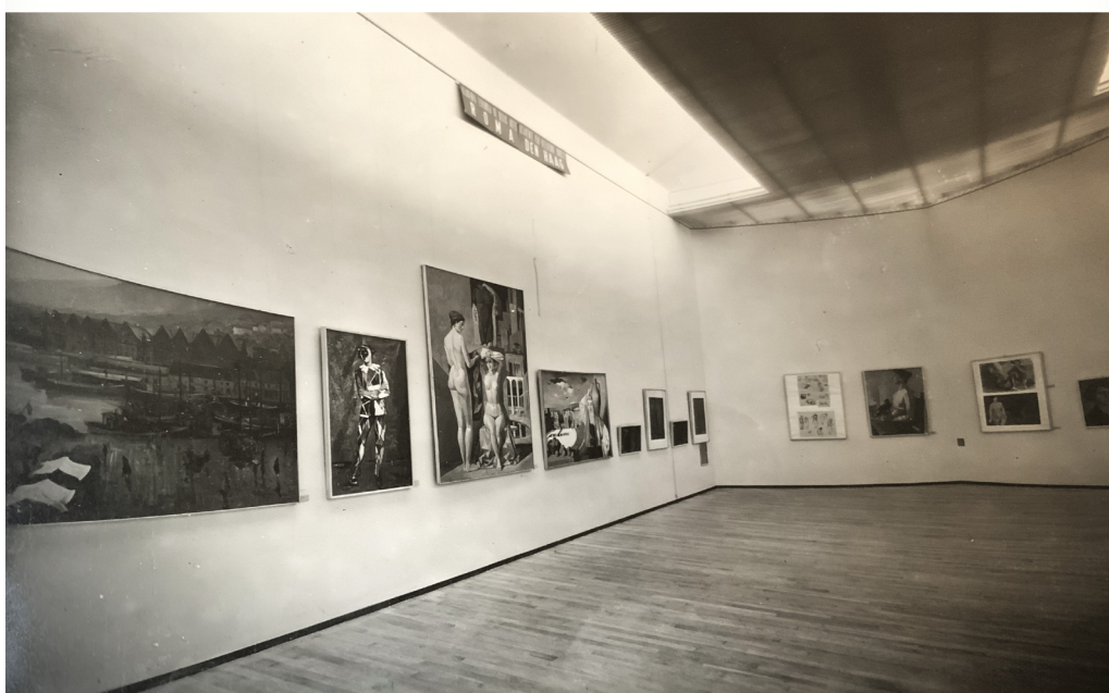
Figura 4. Mostra Internazionale de Accademie di Belle Arti en Milán, 1953