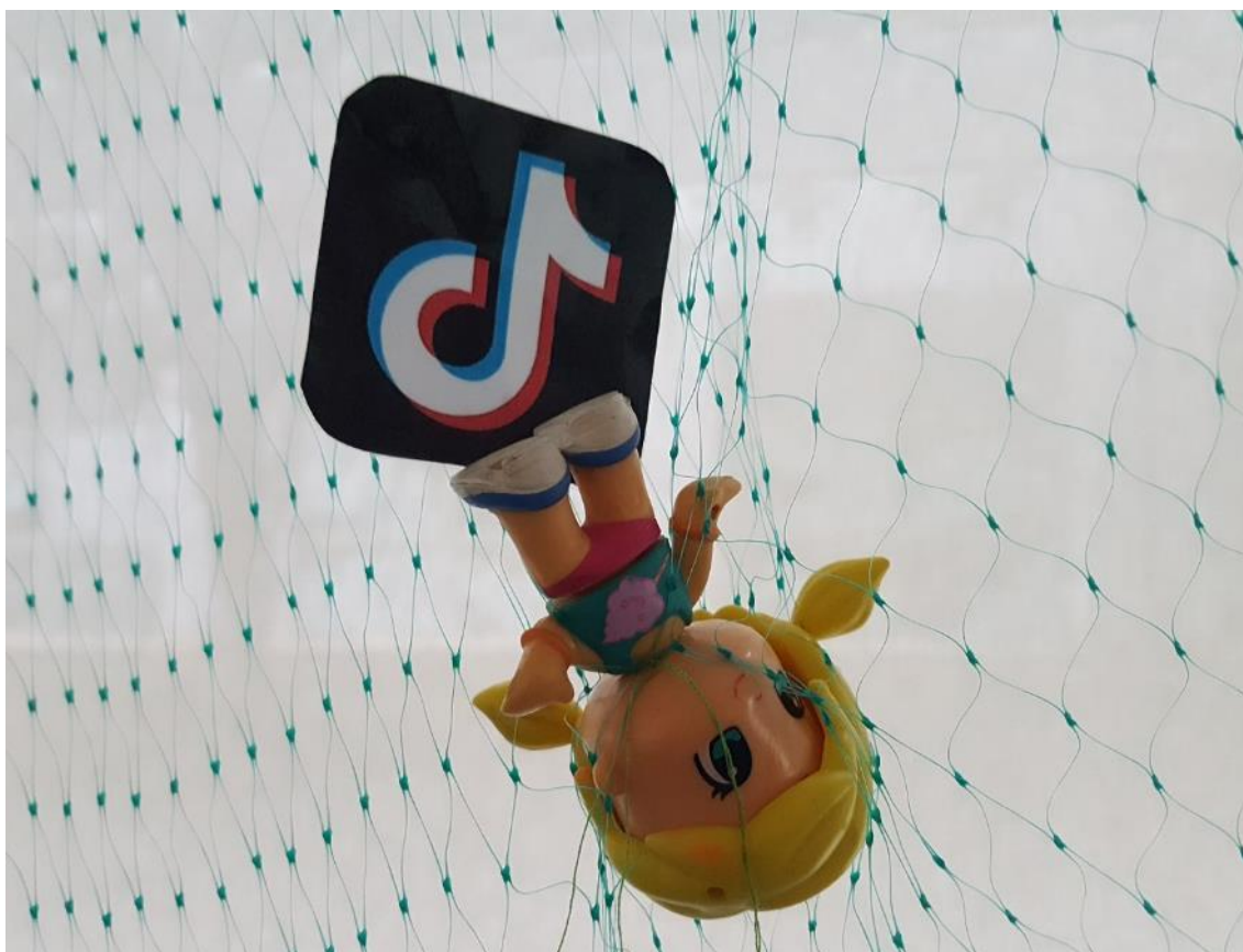
Figura 6. Detalle de la instalación Net del grupo Marguerite Sauvage .

Algunas instalaciones se presentan en formato video, proyectándose en la pantalla gigante ubicada en una zona estratégica del recorrido. Otras plantean una interacción con el público visitante, como es el caso de No signal , del grupo Ada Lovelace , o Women de Anna Staiano , donde también se utilizan códigos QR. El uso de espejos es otro de los rituales que interesan al alumnado,