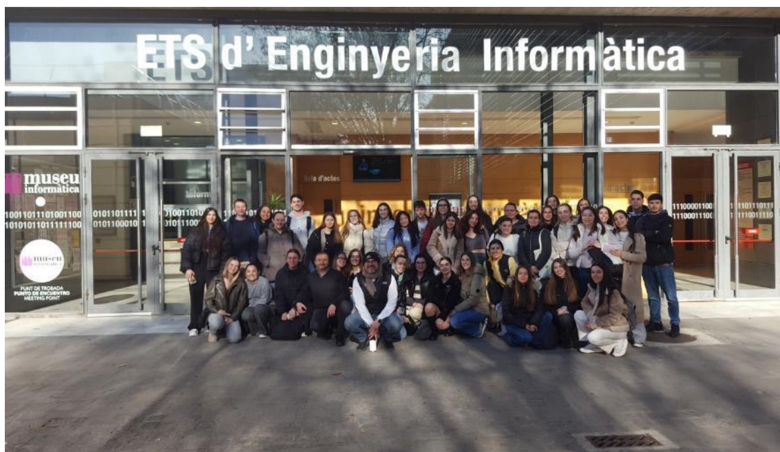
Figura 2. Grupo de alumnado en una de las visitas al museo.

Entre los consejos de las artistas destaca la importancia que adquiere elegir adecuadamente el espacio donde se ubicará cada pieza.