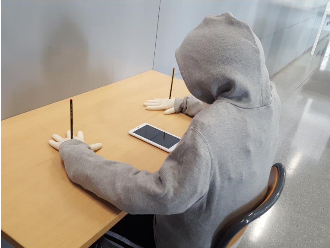
Figura 8. Instalación Cattelan del grupo Carmen Calvo .