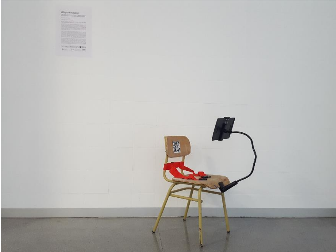
Figura 10. Instalación Ligatum del grupo Yayoi Kusama.