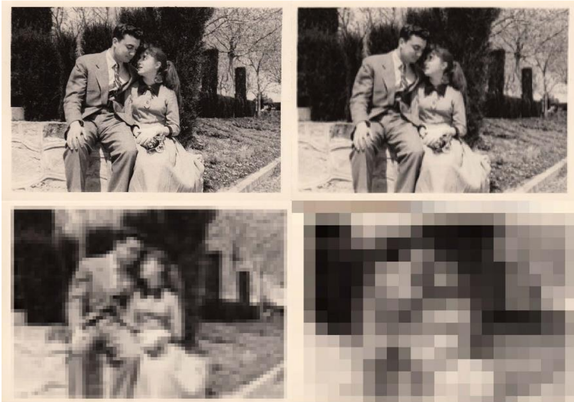
Figura 3. Instalación Campanadas de Alzheimer, del grupo Marina Abramovic.