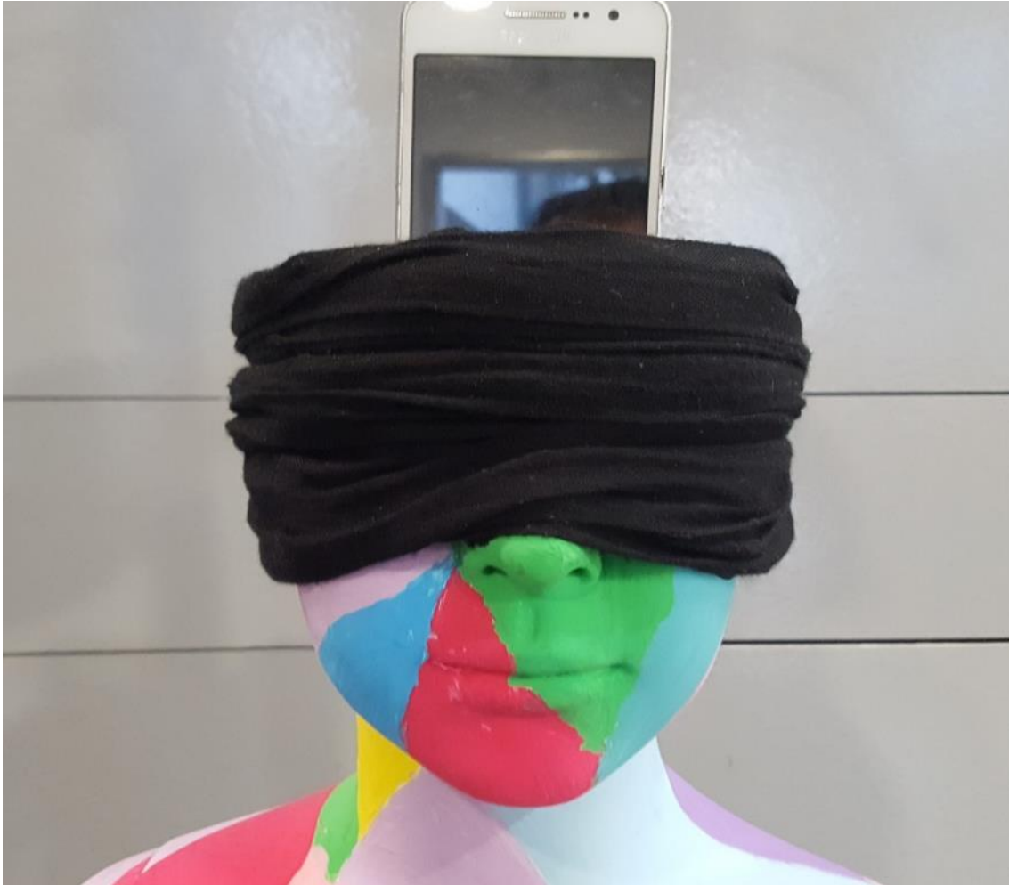
Figura 5. Detalle de la instalación Brain del grupo Flavita Banana .

La instalación Brain que preparó el grupo Flavita Banana resultó muy atractiva [Fig. 5]. A partir del maniquí de un niño, pintaron triángulos de diferentes colores sobre su cuerpo, para posteriormente rebajarle la cabeza, de modo que en su interior apareciese no un cerebro, sino un dispositivo móvil. Con este juego de relaciones se denunciaba la dependencia que sufren actualmente los adolescentes y el resto de la población, constantemente enganchada al móvil. Las componentes el equipo (Raquel de Mingo, Paula Caballero, Marina Dorce, Natalia Bauset y Bienvenida Atienza) concretaron adecuadamente su propuesta, y la llevaron a cabo en el taller. En su cartela planteaban el siguiente razonamiento: “En esta obra hemos querido plasmar la dependencia tecnológica. Para ello, utilizamos un maniquí que representa nuestra sociedad. En vez de un cerebro, el personaje tiene un móvil en su cabeza. Lleva una venda en los ojos que le impide ver más allá del mundo digital. Está pintado de colores vivos ya que aparentamos que vivimos felices ante esta dependencia tecnológica. Prueba a hacerte un selfie con nuestro maniquí y súbelo a #Brain.” Su pieza podía tener repercusión en redes sociales, creando el hashtag #Brain.