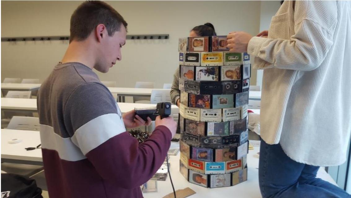
Figura 4. El grupo Jenny Holzer preparando la instalación Data Tower .

Este grupo preparó todo el montaje en el aula [Fig. 4], de modo que sus avances sirvieron como acicate para animar al resto. Su reflexión parte del constante cambio de formatos para almacenar los datos, lo cual supone, en la mayoría de casos, perder mucha información. Además de generar una pieza poderosa, filmaron los pasos de su construcción, de modo que el video del proceso se pudo también proyectar en la exposición. Al pasar la encuesta final al grupo, el 92% del alumnado del curso 2021-2022 contestó: “No imaginaba que mediante el arte podía activar proyectos en todas las materias del currículum.” Esto significa que gracias a la exposición El diseño de los recuerdos se habían sentido personas creativas, y estaban dispuestos a continuar confiando en el arte para acometer retos que nunca antes se habían imaginado.