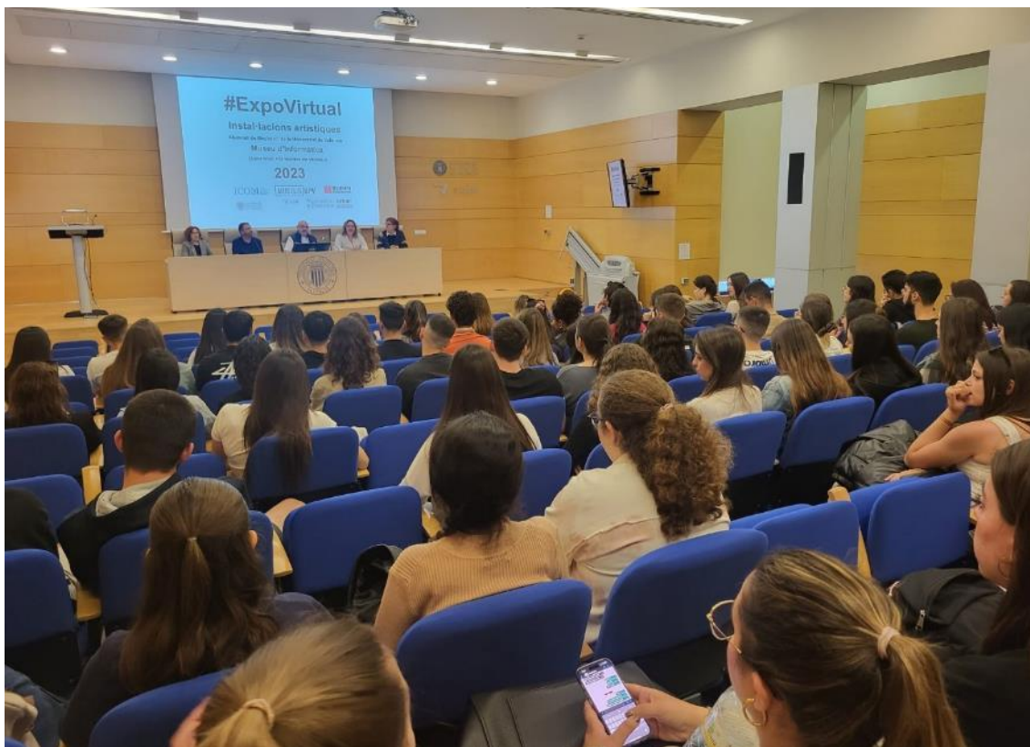
Figura 7. Conferencia inaugural, acto multitudinario que sirve para difundir la exposición.