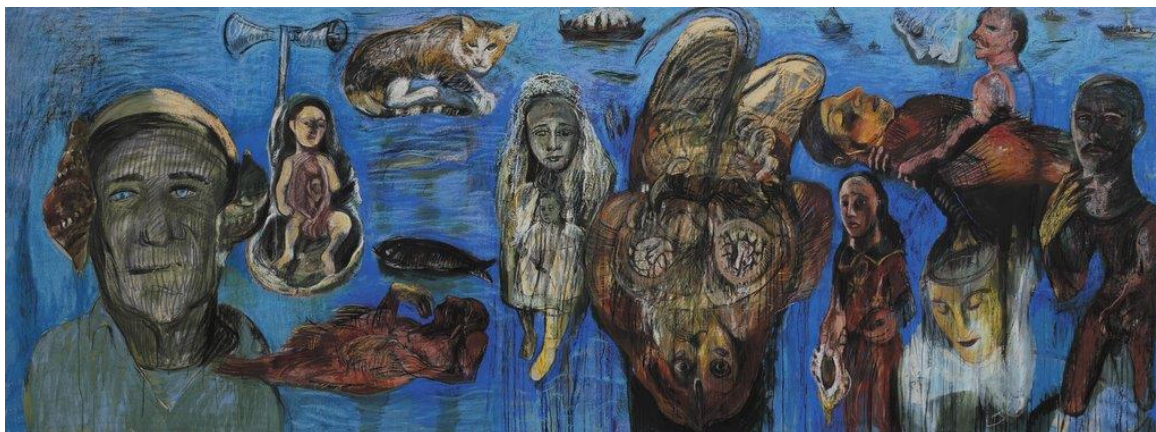
Figura 6. Graça Morais, História Trágico-Marítima. Acrílico, carbón y pastel sobre lienzo, 546 x 203 cm.