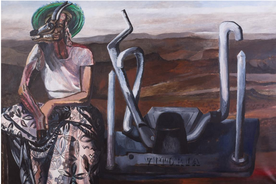
Figura 5. Graça Morais, Sin título (serie Cabo Verde), 1988. Acrílico y carbón sobre lienzo, 130 x 195 cm. (© Graça Morais, cortesía de la Artista)

En el conjunto de pinturas y dibujos producidos en Cabo Verde, es posible comprobar que la relación de la pintora con el territorio caboverdiano se establece no sólo a través de interacciones con las personas y una implicación inmersiva con el lugar, sino también a través de la evocación de experiencias y memorias previas y personales. Por ejemplo, en algunas obras aparecen figuras exóticas –los felinos, la gran serpiente– que no tienen nada que ver con el contexto de estas islas, y que, como reconocería más tarde Graça Morais, están vinculadas a recuerdos lejanos de su infancia en Mozambique, donde vivió entre 1956 y 1958.