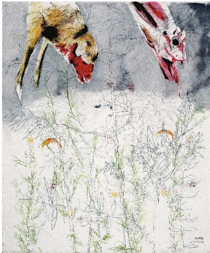
Figura 2. Graça Morais, Páscoa, Vieiro , 1982. Pastel sobre papel, 175 x 147 cm. (© Graça Morais, cortesía de la Artista)

Las pinturas y dibujos realizados en esta fase de producción asumen plenamente la reivindicación de su origen, de lo que es el primer territorio referencial de la artista: el pueblo, el mundo rural, el paisaje montañoso agreste y lleno de contrastes, marcado por las estaciones y los ciclos rurales, y donde se llevan a cabo prácticas y rituales ancestrales que reflejan una estrecha convivencia –no siempre pacífica– entre el Hombre y la Naturaleza.