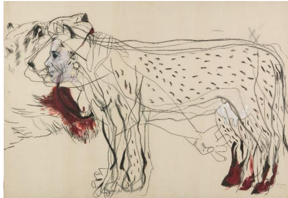
Figuras 3 y 4. Esq.: Delmina , 1982. Óleo y carbón sobre lienzo, 145 x 206 cm. Dir.: Maria , 1982. Óleo y carbón sobre lienzo, 146 x 212 cm. (© Graça Morais, cortesía de la Artista)

Dice Graça Morais (en Fiadeiro, 1983, p. 15) que “La violencia que padecen las mujeres es muy grande. Primero porque trabajan mucho, segundo porque son víctimas resignadas y sumisas”. Debido a la represión que encuentra en las historias de las mujeres de su pueblo, sus representaciones femeninas toman insistentemente la forma de animales, oponiéndose a la figura masculina, que es el cazador, el depredador de estos animales-mujeres. En estas dos pinturas se referencia la violencia latente y la alusión a una “sexualidad brutalista” (Pernes, 2005, p. 14) a través de elementos como picos de pájaros, garras de animales, cascos de bovino. Y, siempre, la presencia de la sangre, que es vida y muerte.