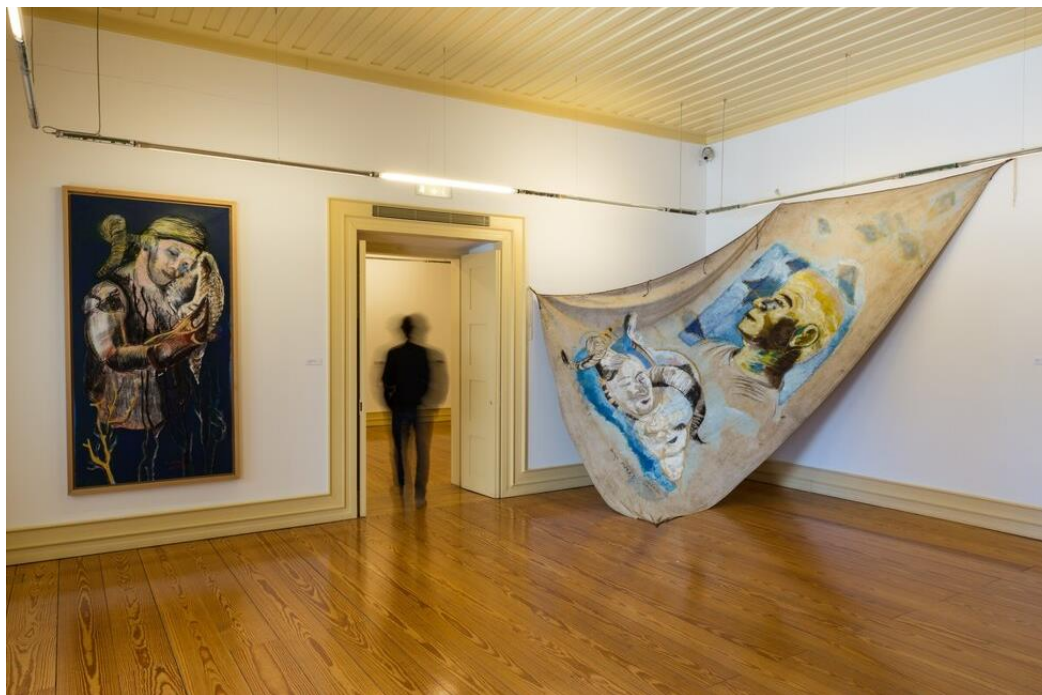
Figura 7. Exposición Olhos Azuis do Mar (Bragança, Centro de Arte Contemporáneo Graça Morais, 2019). A la izquierda, Joana ouvindo o mar... , 2005 (acrílico, carbón y pastel sobre lienzo, 200 x 100 cm); a la derecha, A Vela , 2005 (acrílico, carbón y pastel sobre vela de barco, 455 x 275 cm), con un retrato de un pescador y un autorretrato de Graça Morais.

Otra característica resultante de esta experiencia de acercamiento a un territorio costero fue la exploración de una nueva dimensión en su pintura, relacionada con “el gran espacio, a veces sin límites, a veces sin línea de horizonte, entre el cielo y el mar”, sugestivo de un “lado infinito que nunca encontré en la montaña, pero que encontré aquí” (Morais, 2005, p. 5). Aunque aparentemente alejadas del contexto de Trás-os-Montes, muchas de las obras producidas en Sines siguen haciendo referencia a la territorialidad matricial de la pintora, denunciada en el uso de una paleta de tonos tierra que predomina en varias pinturas y dibujos, o a través de la integración de elementos extraños al contexto marítimo, como los cuernos de carnero que aparecen asociados a algunas figuras –entre ellas las personificadas por su hija Joana o por la propia pintora, en un autorretrato (Fig. 7)–, lo que refuerza así la importancia de sus orígenes en la forma en la que establece relación con todo lo que la rodea, afirmando su plena conciencia identitaria.