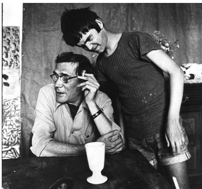
Figura 2. Fotografía de Fernand Deligny y Janmari, en Cévennes en 1973. © Thierry Boccon-Gibod. https://www.liberation.fr/culture/livres/fernand-deligny-lenfant-oublie-20210616_NXEAUQYQJVHNVNSMRF277F34Q4/

Deligny señalará a este niño, al que llamará Janmari (Jean-Marie Jonquet), como su maestro: “Cuando digo que Janmari dirige la tentativa, no es ningún juego de palabras. Si estamos aquí, en estas casas, por ejemplo, es porque Janmari nos ha conducido hasta aquí. ¿Por qué aquí? Porque había una fuente.” (Deligny, 2007, p. 705). Así nació la Tentative des Cévennes , que se desarrollaría entre 1967 y 1996. Deligny propuso una pequeña red de lugares alrededor del Parque Nacional de Cévennes, en el sur de Francia, donde los niños con autismo profundo pudieran permanecer durante diferentes periodos, especialmente durante las vacaciones, constantemente acompañados por adultos, “las presencias cercanas” (Lin, 2007, pp. 68-69).