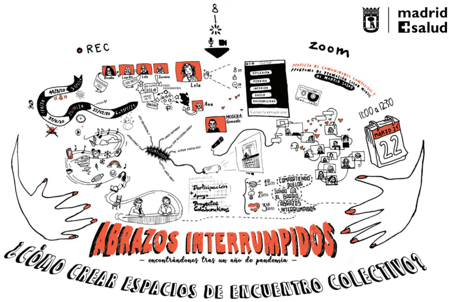
Figura 2. Relatoría gráfica del evento “Abrazos Interrumpidos”. Madrid Salud, 2021. Diseño y relato realizado por las autoras.

Encuentro organizado por el Proyecto Comunidades Compasivas y el Programa de Promoción de la Salud Mental de Madrid Salud con el propósito de apoyar colectivamente el duelo y las pérdidas relacionadas con la pandemia de la COVID-19. Se desarrolla en formato online el 22 de marzo de 2021 como un espacio de reflexión colectiva y encuentro para compartir vivencias relacionadas con cómo se afrontan estos duelos de la manera más saludable posible. Asisten más de 70 personas, agrupando profesionales de la institución principal, personas colaboradoras de distintas disciplinas y vecinos y vecinas de diferentes distritos de la ciudad de Madrid que colaboraron o formaron parte de numerosas iniciativas o proyectos durante el confinamiento.