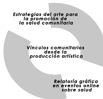
Figura 1. Círculo relacional de conceptos clave. Diseño de las autoras.

De esta manera, el punto de partida clave es el nexo entre tres conceptos interrelacionados (Fig. 1) que fundamentan el uso y análisis de esta estrategia en contextos de bienestar y salud: (1) uso de estrategias del arte para la promoción de la salud comunitaria, (2) creación o conservación de vínculos desde las producciones artísticas, y (3) uso de relatorías gráficas para la salud y el bienestar en eventos online.