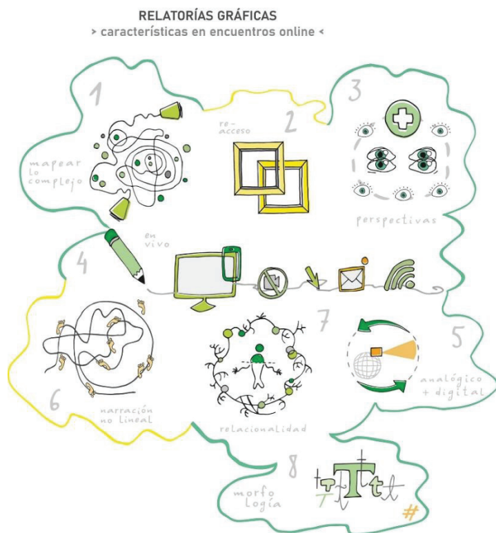
Figura. 5. Relatoría gráfica de análisis de resultados: formas de amplitud de las características en relatorías gráficas para encuentros digitales no presenciales. Diseño y relato analítico realizado por las autoras.

Estas similitudes, matices y diferencias detectadas se representan en la siguiente relatoría gráfica (Fig. 5), que funciona como síntesis del análisis de la investigación.