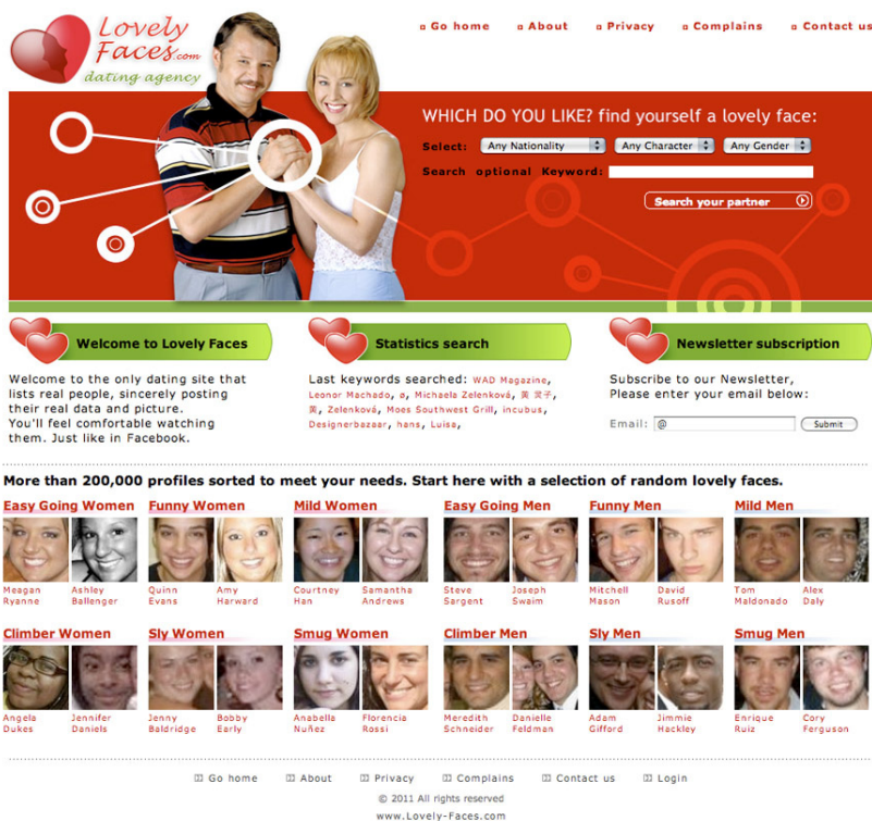
Figura 1. Face to Facebook (2011). Paolo Cirio y Alessandro Ludovico.

función de los rasgos y las expusieron durante 5 días “a emocionantes reacciones personales, mediáticas y legales, transformándose en una Global Mass Media Performance”. ( Face to Facebook 3 , s. p.).