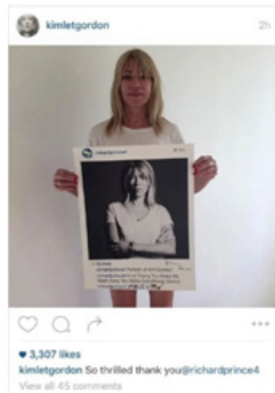
Figura 5A. Instagram/@doedeere, foto robada en New Portraits (2014) de Richard Prince.