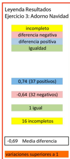
Figura 3. Resumen de datos.

En el caso de la evaluación de pares, la propia herramienta “Taller” permite conocer la capacidad de evaluación de cada alumno en comparación con el resto de calificaciones otorgadas a un mismo alumno.