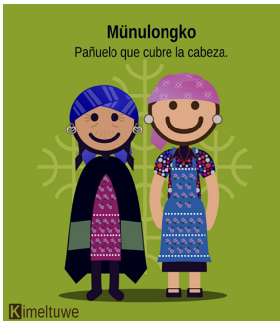
Figura 4. Categoría sociedad/cultura; indumentaria mapuche.

Los valores y modos de ser particulares de este pueblo son patentes en la exposición icónica de la gastronomía tradicional mapuche, sus prácticas, tanto cotidianas como ceremoniales, entre otros. Particularmente en lo referente a la comida suelen representar el acto de tomar mate ( matetun ), el consumir harina tostada, sopaipillas , los huevos de gallina mapuche ( kollonka ), entre otros productos.