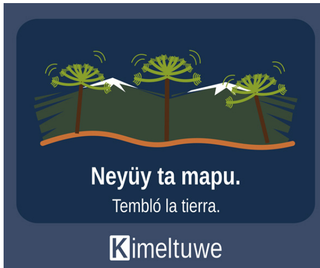
Figura 5. Categoría naturaleza/tierra. Representación de un terremoto.

Aquí se puede ver claramente el ejercicio de la interculturalidad que sostiene el pueblo mapuche al incorporar distintos elementos “externos” a su sociedad y darles funcionalidad en la propia, al mismo tiempo que lo originario mantiene su estatus en un proceso de complementariedad (García, 2009). Así también, los iconos naturales se convierten en este sistema estético propio que es el trasfondo de las prácticas artísticas mapuches como indica la misma Mabel García (2009).