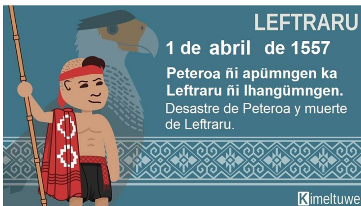
Figura 2. Categoría política/activismo; conmemoración del fallecimiento de uno de sus líderes.

Es visible también la utilización de gráficos y referencias a la cultura pop, utilizando el simbolismo e iconos culturales de otros países, e incluso (a veces a modo antagonista) de la cultura chilena, de los cuales se apropian de manera funcional.