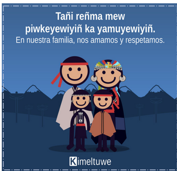
Figura 6. Categoría familia. Representación del hogar. Fuente: Kimeltuwe (2016).

Se refleja la importancia que se le otorga al linaje, la jerarquía de los mayores, la educación de los niños, la esperanza en las nuevas generaciones y la tradición familiar. Aunque la imagen de la familia está reflejada en la mayoría de las creaciones de Kimeltuwe, no se refuerza a través del discurso explícito, por lo tanto, en este aspecto se convirtió en una categoría secundaria. Tal como menciona Quilaqueo (2015) la familia es la unidad básica de transmisión de sabiduría, conocimiento y, por lo tanto, es un eje central del aprendizaje. El tuwün y el küpan , territorio y linaje, inciden y al mismo tiempo buscan ser dos procesos reafirmadores de la figura de la familia.