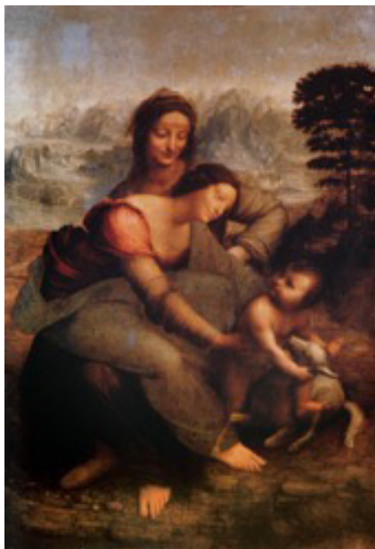
Figura 2. Leonardo da Vinci: Santa Ana, la Virgen y el niño , 1510. Musée du Louvre. (Disponible: www.louvre.fr/en/expositions/saint-anne-leonardo-da-vinci ).

prisma del deseo. El maestro vienés advirtió que el mito, el arte y la religión de la antigüedad procedían del mismo manantial energético que descubrió en sus estudios clínicos gracias al paradigma de la metapsicología , teoría que pasó a ser la explicación hegemónica de la física y la dinámica del inconsciente durante el siglo XX.