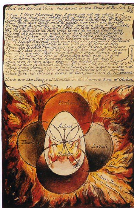
Figura 4. William Blake: El huevo cósmico . 1808. Ilustración de Milton. The William Blake Trust. (Disponible en: www.blakearchive.org/cosmic-egg ).

Deleuze muestra el imaginario freudiano como un teatrillo familiar donde el neurótico identifica las fantasías con las distintas figuras totémicas relacionadas con sus traumas infantiles. Según el pensador francés el inconsciente quedaría liberado de sus moldes freudianos, de su fantasmagoría edípica y podría explorar la capacidad energética de la libido para producir realidad. Para Deleuze el Ello no representa nada, no significa nada, no se puede interpretar ni moralizar, no genera culpa ni carencia porque es inagotable, como las fuentes míticas, es una máquina de producción deseante (Deleuze, 2005).