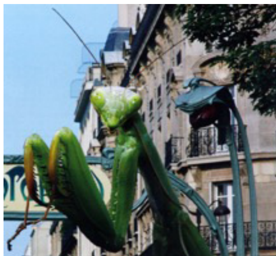
Figura 3. Frédéric Descouturelle, André Mignard y Michel Rodríguez: Comparación de las farolas de acceso al metro de París con una mantis religiosa . 2012 (Disponible en: Descouturelle, F. et alt. [2012]).

Como trofeos de caza decapitados, estos fetiches de la hermenéutica psicoanalítica adornaron el gabinete de Freud y después se hicieron comunes en los despachos de los terapeutas en forma de máscaras africanas, figuras votivas, metopas clásicas o ídolos antropomórficos que recordaban a los pacientes sus traumas originarios, es decir, la genealogía fantástica de su malestar: que a menudo se remontaba a alguna escena de castración.