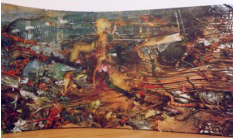
Figura 1. Fabian Marcaccio: Energía-libido-información . 2004. (Procedente de www.paintantscorporation.com ).