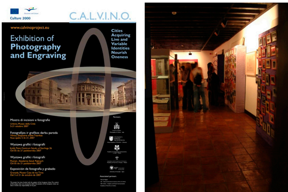
Figura 3. Imágenes propiedad del CALVINO Project . Los resultados fueron dados a conocer en las exposiciones simultáneas interconectadas por videoconferencia. En Granada se organizó en el Museo Casa de los Tiros, museo de arte y costumbres de la ciudad. En las imágenes se reproduce el cartel de la exposición, diseñado por el consorcio y una vista de la sala del museo. Fotografía tomada por Irene Fernández Martínez, 2007.