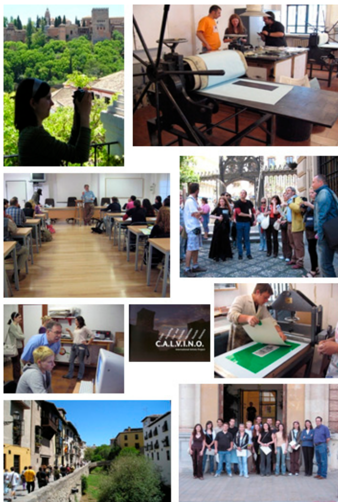
Figura 1. Fotografías propiedad del CALVINO Project , realizadas por Irene Fernández Martínez, becaria de colaboración del Departamento en el área de Didáctica de la Expresión Plástica en el año 2007. En las distintas imágenes se puede apreciar parte de los procesos de aproximación, experimentación, formación y representación implícitos en el proyecto. La portada del catálogo ( C.A.L.V.I.N.O. , 2007) aparece reproducida en el centro. Granada. 2007.

El objetivo principal fue implementar un proceso creativo e imaginativo donde los habitantes de las ciudades pudieran experimentar con la posibilidad de ver su propia ciudad a través de las representaciones artísticas. De este modo los espectadores toman conciencia de que las visiones resultantes dependen de la capacidad que tiene la propia ciudad de interactuar con los creadores en diversos aspectos y niveles.