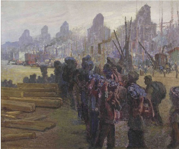
Figura 4. Ribera del Plata, 1922. (Pío Collivadino).

Ribera del Plata (1922) es un cuadro de puerto, pero aquí, mucho más que en otros, adquiere una relevancia central el trabajo. Generando dos filas, como una cinta transportadora, los trabajadores cargan con el peso de la mercadería que retiran de los barcos. Sus brazos de color rosa argentino, que sostienen las canastas sobre sus hombros, ocupan el lugar de sus cabezas, mientras que los rostros inclinados apenas se percibe. La textura adquiere en estos trabajadores la dimensión de una masa, mientras que en el fondo, por detrás de la humareda que surge de los barcos, se erige, aplanada y gris, la ciudad, conformada por una serie de rascacielos, cada uno igual al otro, que se repite hacia el horizonte infinito. La tensión entre el trabajo, la fuerza y el resultado del progreso es desplegada así en todo el cuadro, invirtiendo el ángulo de visión del ciudadano y evidenciando cuáles son las espaldas sobre las que se sostiene el motor de aquel progreso, que configura la heterogeneidad del ser argentino.