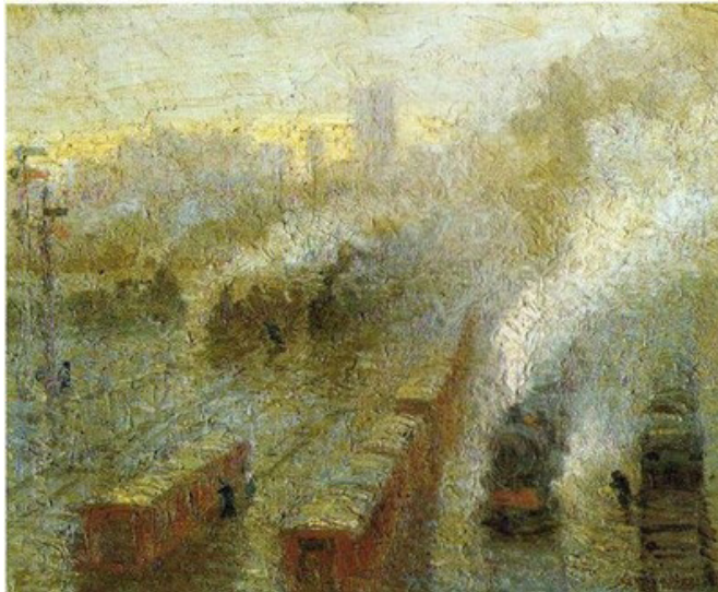
Figura 3. Humo de trenes o Máquinas en movimiento, 1910. (Pío Collivadino).

con el desarrollo de su obra irá ocupando cada vez una porción más predominante. En Humo de trenes o Máquinas en movimiento (1910), la textura no se limita a los márgenes del cuadro, sino que es la forma del tratamiento de toda la pintura. No es la cal aquí el material, sino el humo, cuya densidad es el resultado del movimiento de los trenes, que, captado desde un ángulo elevado, apenas permite divisar el fondo de la ciudad en crecimiento. Ya no está la figura por un lado y el material por el otro, sino que las figuras surgen, desdibujadas, en la superficie de la acumulación de la pintura.