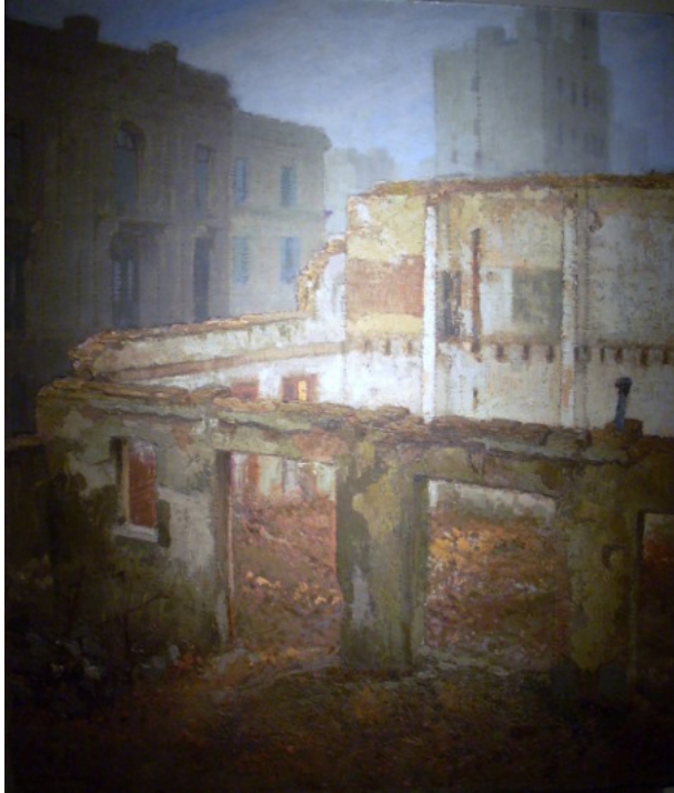
Figura 6. Demolición abandonada, 1935. (Pío Collivadino).

un proyecto inherentemente inacabado. Estas obras fueron la señal de advertencia de los duros años venideros, que la distorsión del recuerdo de este gran pintor no supo descifrar.