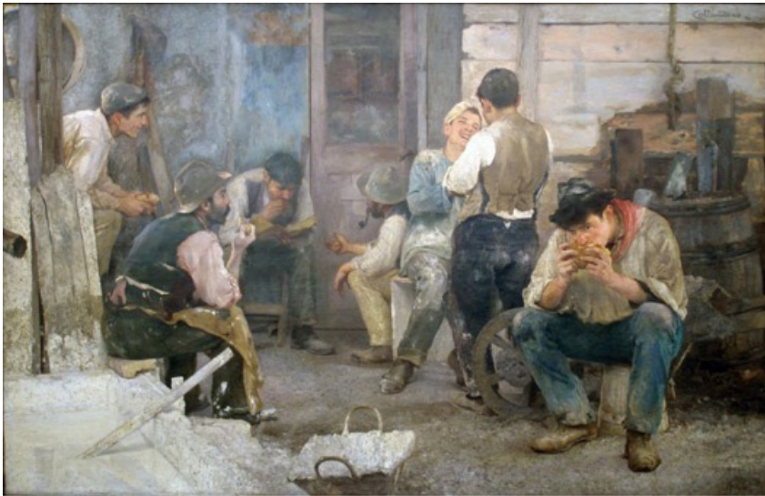
Figura 1. La hora del almuerzo, 1903.(Pío Collivadino).

En 1903, Collivadino obtuvo la medalla de oro en la exposición de Venecia por la obra realizada durante su estadía en Italia La hora del almuerzo , que, como supo destacar Martín Noel, por su “crudo verismo profundamente humano y de intensidad psicológica interpreta las preocupaciones sociales de la época” (Noel, 1947, p. 18). Allí aparecen siete obreros en su momento de descanso, conversando, comiendo, fumando pipa. Uno de ellos no participa de los grupos y come solo, mirando hacia el horizonte. Se destaca el pañuelo que le cubre el cuello de color rosa argentino . Durante el siglo XIX, este fue el color predominante elegido para las fachadas en todo el territorio, obtenido de la mezcla de sangre bovina con cal. Inmortalizado por Sarmiento al pintar de ese color la Casa de Gobierno, también tiene un significado simbólico, dado que la mezcla del blanco con el rojo unía los colores de las principales facciones políticas que se disputaban el poder en ese entonces.