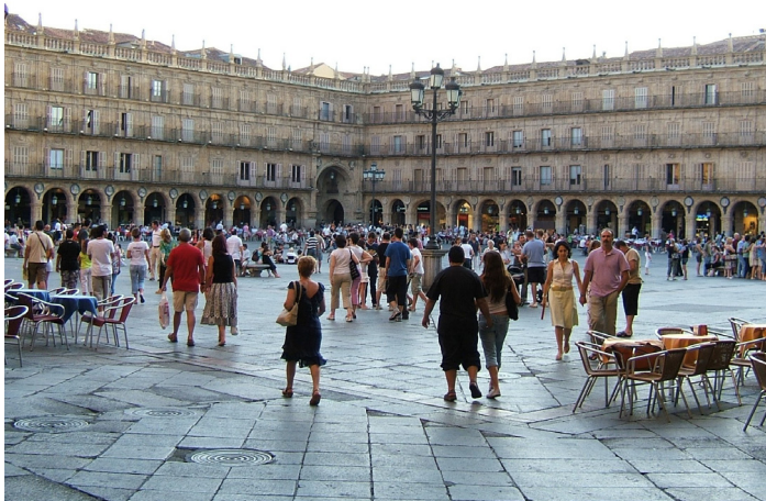
Figura 5. Plaza Mayor, Salamanca.

del espacio público sea un hervidero de actividad, una vorágine urbana donde tienen cabida todo tipo de usuarios y de actividades heterogéneas. Para garantizar esa tensión urbana, resulta muy recomendable que tanto las actividades de atracción en los bordes participen del espacio público como que el propio espacio público participe de las actividades de atracción: son los espacios de transición entre lo estrictamente público —espacio central de la plaza— y lo estrictamente privado —arquitecturas perimetrales—. Esta idea de fortalecer los bordes del espacio público y liberar los espacios centrales, justifica la buena acogida histórica y vigencia contemporánea —tanto social como estética— de los espacios porticados habituales en las plazas mayores, limitados por soportales que generan a través de la propia arquitectura ese espacio de transición anteriormente aludido y enriquecen importantemente la relación entre espacio público y espacio privado (Fig. 5).