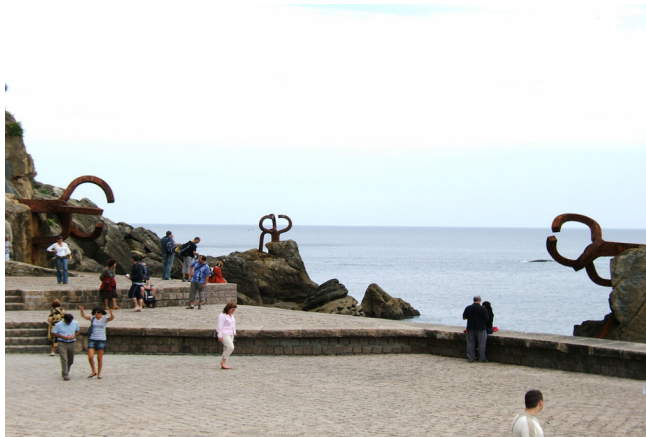
Figura 2. E. Chillida y L. Peña Ganchegui, Peine del Viento y Plaza del Tenis en San Sebastián, 1977.

Otra circunstancia que evidencia la crisis estética del espacio público es la falta de diálogo entre arte urbano —esculturas, monumentos y otros elementos artísticos— y el propio espacio en el que se implantan. El arte público urbano, a diferencia de otras expresiones artísticas, suele concebirse para que esté situado en un lugar concreto, y sólo en él. Esa relación continente-contenido es inherente al intrínseco valor estético de la obra de arte: “lo singular en una ciudad no son sus monumentos, sino la disposición de ellos en su entorno [...]. El hecho escultórico o arquitectónico refleja la convicción de lo óptimo de un asentamiento, que lo dispone, lo sella y lo simboliza” (Ayús, 1996, p. 65). La ubicación no puede ser universal cuando la relación entre objeto y espacio es muy estrecha y solidaria, algo que se puede reconocer ejemplarmente en El Peine del Viento de Chillida y la actuación urbana de Peña Ganchegui (Fig. 2).