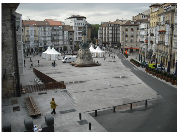
Figura 1A y 1B. Plaza de la Virgen Blanca, Vitoria. Aspecto en 2006 y en 2008.