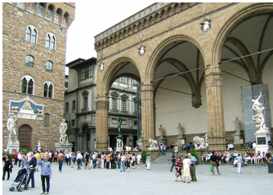
Figura 3A, 3B, Praça do Comércio, Lisboa y Piazza della Signoria, Florencia.

También la posición relativa del perceptor puede llegar a intercambiar esta sensación: la visión de un espacio público lleno de gente desde una posición alta da una apariencia de mayor tamaño respecto a cuando está vacío. Ello se debe no sólo por su observación, sino por la entrada en juego de otros sentidos, como el oído, ya que el rumor de la gente o de sus pisadas, contribuyen a magnificar la percepción general de un espacio público densificado (Fig 4A, 4B).