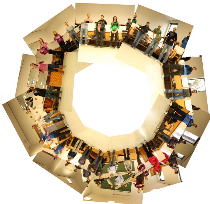
Figura 3. Percusión corporal de pie en dos círculos concéntricos (enero de 2012). Facultad de Educación de la Universidad de Alicante, España.

El círculo como el área contenida por la circunferencia que configuran las personas al situarse unas próximas a otras, es entendido aquí como lugar de encuentro educativo. Sabemos del término como forma de interacción social en sus diversas acepciones. Todo ello participa de la idea de esta figura que es inclusiva, integradora, que convoca, reúne y resulta intermediadora de los procesos de enseñanza. Desde el punto de vista didáctico el profesor percibe que no se enseña, ni se aprende de la misma manera cuando uno se sitúa tras una mesa, que cuando permanece de pie, o sentado, o en posiciones que determinan jerarquías. El círculo favorece un aprendizaje horizontal, donde se cruzan las miradas de estudiantes y profesorado. El círculo posibilita una comunicación no verbal, al permitir observar las caras, cuerpo y gestualidad de todos los participantes y no exclusivamente la del docente. Por todo ello el círculo es la disposición en el aula que mejor representa el modelo de enseñanza-aprendizaje por el que abogamos en las disciplinas artísticas. Por supuesto no monopolizando por completo el transcurso de las sesiones, pero sí haciendo acto de presencia en una gran parte de las dinámicas empleadas.