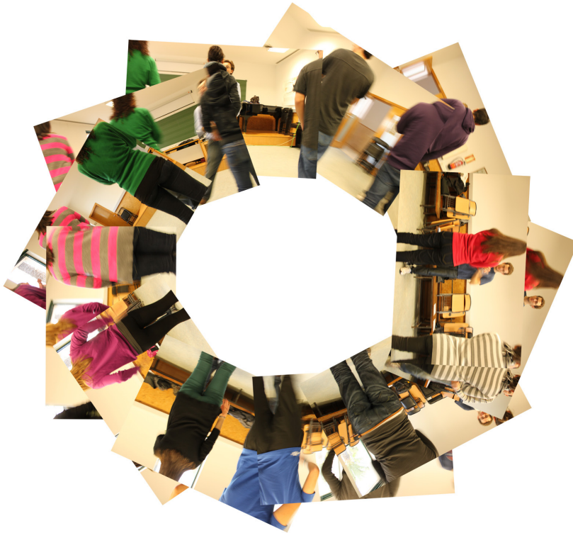
Figura 5. Percusión corporal de pie en círculo (enero de 2012). Facultad de Educación de la Universidad de Alicante, España.

Así, como mínimo común múltiplo de nuestros resultados, se generan en todos los collages estructuras circulares en las que las fotografías en color se distribuyen de forma radial, por ser el modelo compositivo que mejor describe la posición básica de aprendizaje circular empleada en la percusión corporal. En este sentido se constata que las fotografías utilizadas en esta investigación sirven como modelo de visualización que expresa un razonamiento visual de análisis del espacio “aula de música” en relación con el cuerpo. Pero para enfatizar unas u otras relaciones del análisis se refuerza el uso de unos u otros recursos, tal y como puede observarse en los resultados.