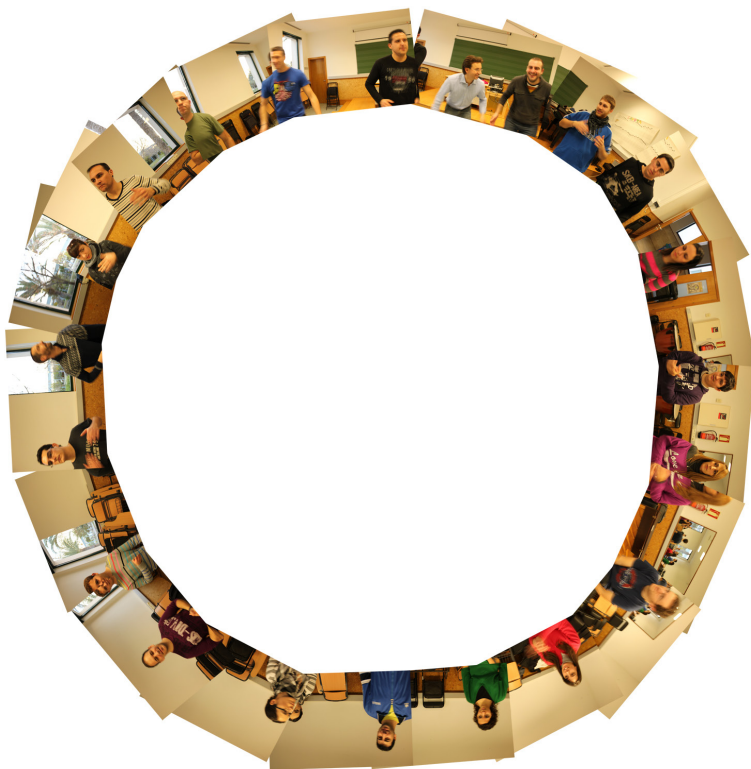
Figura 6. Percusión corporal de pie en círculo (enero de 2012). Facultad de Educación de la Universidad de Alicante, España.

El docente de música que desea realizar su investigación sobre los procesos resultantes de su propia práctica, o de las prácticas educativas de un grupo de profesores, dispone de numerosos entornos en los que documentar sus acciones, especialmente en el tramo del trabajo de campo. Para nosotros el concepto de “aula de música” es amplio, y comprende varios escenarios. (Huerta, 2010, p. 19)