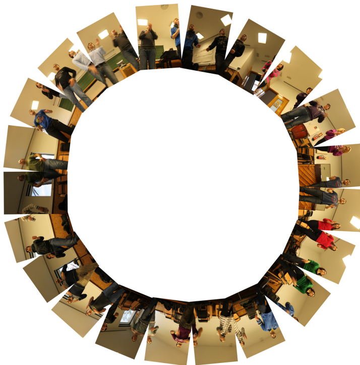
Figura 4. Percusión corporal de pie en círculo (enero de 2012). Facultad de Educación de la Universidad de Alicante, España.

Atendiendo a los conocimientos fotográficos hallados en la obra “Shanghai planet 2009” de Isidro Blasco se ofrecen modelos de visualización que ponen de manifiesto alguno o varios de los recursos empleados por el artista, pero no todos a la vez. Pues no se trata de reproducir una obra del artista con temática diferente. Lo que se persigue es poner en práctica, en función del problema a estudiar, las formas de construir que este artista de reconocido prestigio ya ha validado. También se barajan algunos recursos que en otras obras artísticas ha empleado el artista a lo largo de su trayectoria.