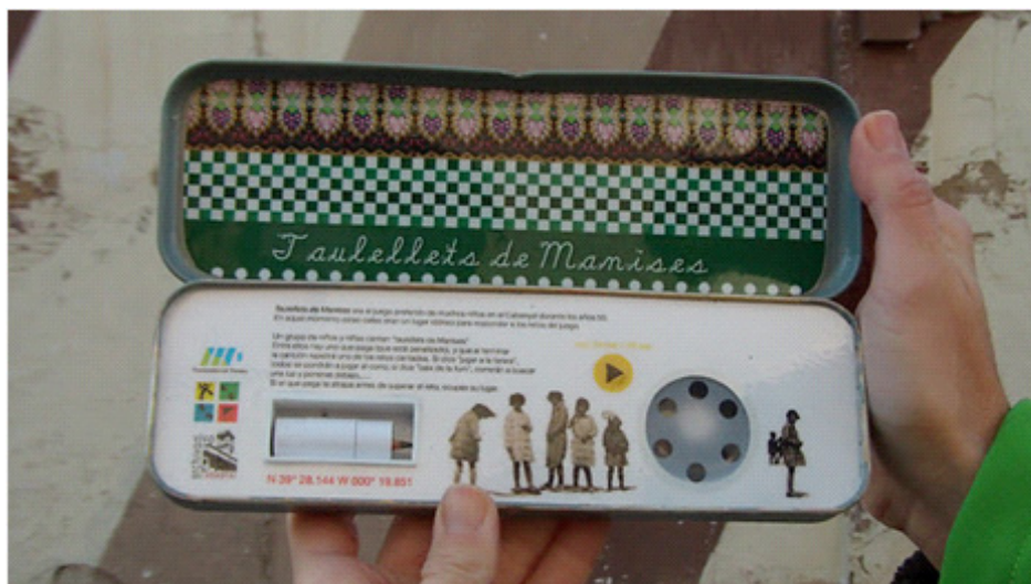
Figura 1.A. Encuentre la memoria , Transnational Temps, 2011.

El colectivo Transnational Temps ha realizado varios caches audiovisuales que amplían la información en un lugar determinado. Recientemente, en la exposición Derivas virtuales en El Cabanyal realizada en el barrio de Valencia que lleva ese nombre y comisariada por Emilio Martínez, el colectivo situó caches con memorias sonoras. Uno de ellos, por ejemplo, describe un juego al que jugaban los niños de El Cabanyal y en él podemos oír la canción que marcaba el inicio del juego. En el geocaching, los elementos ocultos en el espacio son tesoros. Lo son por el simple hecho de que son objetos del deseo (objetos buscados). La idea del colectivo es convertir el cache en un objeto realizado minuciosamente, un mensaje dedicado a la comunidad que potencie el diálogo entre espacio y memoria, como si los lugares ocultos fuesen “agujeros en el tiempo”.