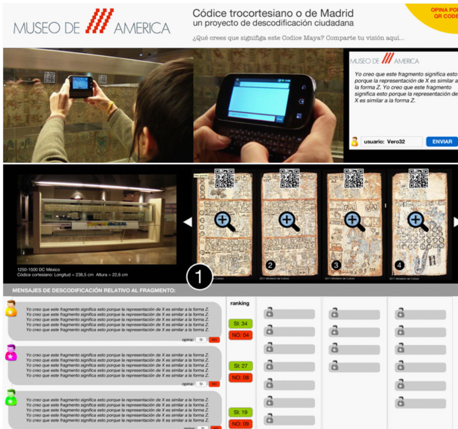
Figura 3. Imágenes del uso de la herramienta con QR code, (simulación para el Museo de América), 2012.

El funcionamiento de esta herramienta sería el siguiente: en el marco exterior del soporte del código (ver imagen 1) se incluirían imágenes de QR code, están vinculados a una página web en la que los usuarios pueden leer o añadir interpretaciones sobre la página del código. El sistema se autogestionaría con un sistema simple de votaciones, del tipo like or dislike que situaría en primer lugar las interpretaciones más valoradas por los usuarios. Todos los saberes son libres e iguales en derecho, dice Michel Serres; “la ignorancia absoluta existe tan poco como la sabiduría absoluta” (SERRES,1995:170).