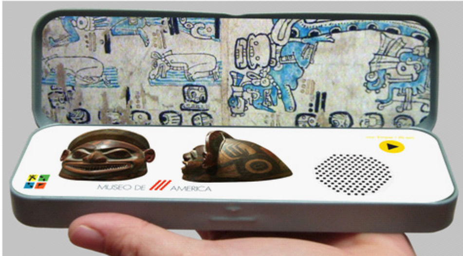
Figura 1.B. Simulación de cache para el Museo de América, 2012.