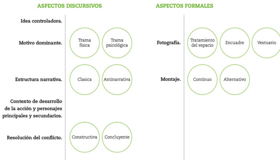
Figura 2. Diagrama resumen de todos los aspectos de análisis presentes en las fotoanimaciones realizadas por el alumnado

Una vez explicadas con detalle todas las cuestiones a analizar con respecto a las fotoanimaciones realizadas por los estudiantes procedemos a realizar un diagrama resumen de todos estos aspectos.