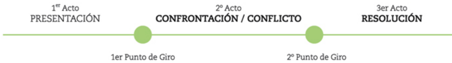
Figura 1. Esquema comparativo entre una posible representación del desarrollo humano y el paradigma clásico de la estructura dramática.

Aunque lo cierto es que hoy en día son numerosas las rupturas que se producen con respecto a este paradigma clásico dentro de la narración audiovisual. Tendencias como el videoarte o las corrientes cinematográficas artísticas —expresionismo alemán, surrealismo francés, neorealismo italiano, etc.— no poseen estructuras narrativas claramente marcadas, pero la verdad es que los elementos más básicos continúan presentes incluso en estas nuevas formas. Eso es lo que defienden, al menos, autores como Bordwell y Thompson (1995) o McKee (2004), que denominan a estas estructuras “sistemas formales no narrativos” o “antitramas”, respectivamente.