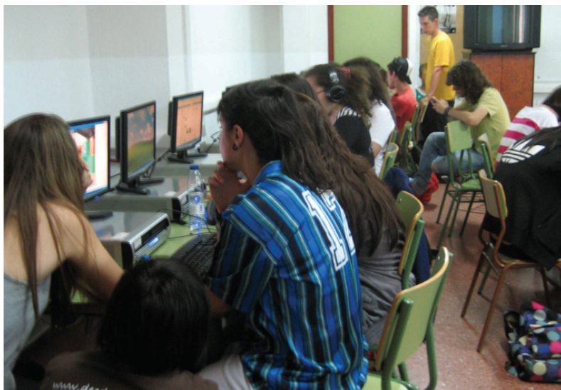
Figura 4. Grupo de alumnos/as de la asignatura de Cultura Audiovisual durante el proceso de creación de las fotoanimaciones.

Como síntesis solo nos queda aclarar que los investigadores no intervenimos ni en la gestación de las ideas, ni en lo que se refiere a la creación de las obras audiovisuales. Por el contrario, nos encontramos en el aula como observadores y nuestra única intervención se produce al comienzo de la experiencia a la hora de explicar conceptos como el storyboard o el guión. Podríamos decir que una vez comenzado el proceso creativo nuestra intención no es guiar al alumnado hacia la consecución de un producto final de una calidad determinada, sino ser testigos de la forma en la que ellos mismos ejecutan sus creaciones.