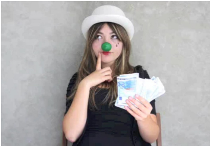
Figura 5. Fotograma de la fotoanimación “NO al materialismo” que es posible ver al completo en la dirección web http://narrativasfotoanimadas.blogspot.com.es/

En esta fotoanimación somos testigos de cómo una joven, que consigue de manera repentina mucha cantidad de dinero, hace cálculas sobre cómo gastarlo. En primer lugar piensa en una casa, después en un coche, más tarde en joyas y zapatos, hasta que todo ello desemboca en una estabilidad que la lleva a la búsqueda de una pareja y a la formación de una familia. El relato combina, por lo tanto, una reflexión acerca del dinero y una crítica hacia la estabilidad considerada como objetivo dentro de la sociedad de consumo. Esta joven, que se topa con la tentación de gastar su dinero de forma desmesurada gracias a su fácil obtención acaba por encontrarse también con un conflicto interior que la empuja hacia lo establecido, lo considerado como bueno en una “sociedad ideal”. Finalmente, venciendo a la tentación, acaba por producirse en ella una transformación que la lleva a renunciar al dinero rechazando también con ello la comodidad de las convenciones sociales y abogando por su independencia y su libertad de decisión.