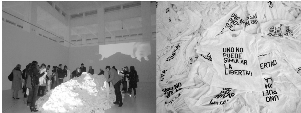
Figura 2. Rirkrit Tiravanija, Una larga marcha . Instalación en CAC Málaga 2009.