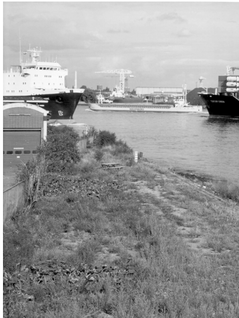
Figura 1. Lara Almarcegui, Un descampado en el puerto de Rotterdam , (Concesión desde 2003 hasta 2018) Rotterdam 2003.

La intensidad metafórica de este tercer paisaje de Clément se reconoce fácilmente en muchas aspiraciones sociales y culturales cuyo imaginario no expresa, efectivamente, ni el poder ni la sumisión al poder. Son nociones estrictamente paisajísticas y ecológicas que, sin embargo, participan del aire de los tiempos y coinciden con muchas de las ideas que han conformado el debate artístico de las dos últimas décadas. Ideas que, desde diversas ópticas, inciden en que el arte, sea desde la acción estética, sea desde la acción relacional, o bien desde la acción crítica, tiene su campo de actuación efectivo en/o a través de los “terceros paisajes” de nuestros entornos y sociedades.