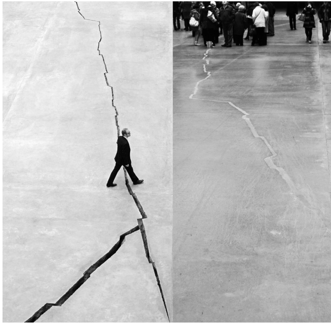
Figura 4. Doris Salcedo, Shibboleth , Tate Modern, Londres 2007. A la derecha, estado en 2012.