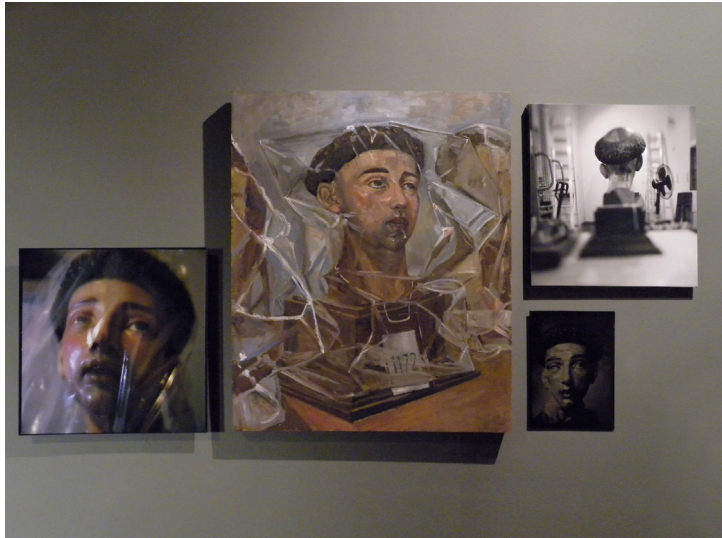
Figura 2. Ariño, Casanova, Egea, Mutell, Mnemosyne 1 (a partir de San Pedro Mártir MFM 1172), 2011. (Proyecto Trans-formare, Museo Frederic Marès)

Mártir , de ojos desencajados que se elevan hacia el cielo y de rostro surcado por las gotitas de sangre que rezuman de su herida en la cabeza. Gesto, intensidad dramática y sensibilidad de época moderna hacen revivir la esencia del pathos de la Antigüedad a los ojos del público contemporáneo a la vez que invocan, necesariamente, la lectura clásica de este concepto.