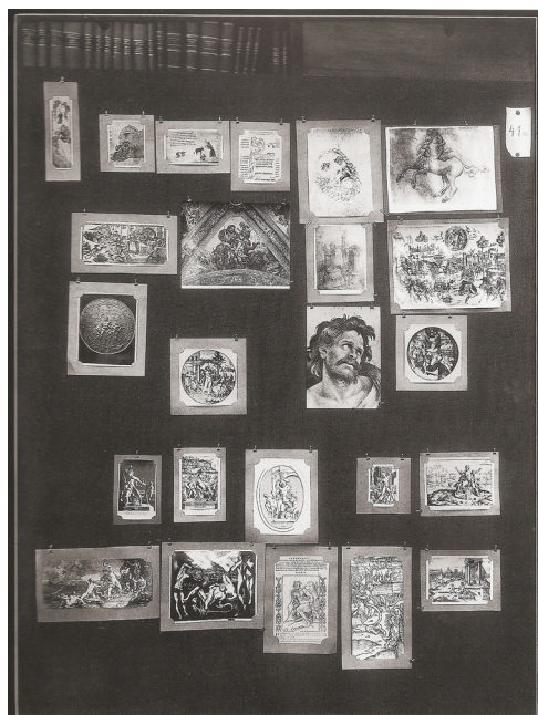
Figura 1. Panel 41a del Atlas Mnemosyne de Aby Warburg: “Expresión de sufrimiento. Muerte del sacerdote” (Warburg, A. (2010) Atlas Mnemosyne. Edición en Castellano, Madrid, Akal/Arte y estética, pp.74-75)

en total sintonía con el del trabajo de Warburg, dado que mantiene su voluntad de enseñar sin resumir, de mostrar sin reducir ni recortar, huye de jerarquizaciones y no presenta unos márgenes necesariamente delimitados. Al mismo tiempo, ambos proyectos están arraigados a un planteamiento más iconográfico que formalista, porque desvelan los contenidos y los temas seleccionados sin centrarse exclusivamente en los aspectos estilísticos, estéticos o formales de las imágenes trabajadas. En ellos, se pone de manifiesto el puente a las investigaciones y los enfoques más sistematizados de Erwin Panofsky.