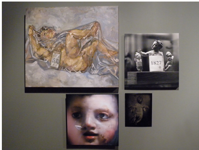
Figura 5. Ariño, Casanova, Egea, Mutell, Mnemosyme 3 (a partir de las figuras MFM 1848, MFM 1830, MFM 1831, MFM 1827), 2011(Proyecto Trans-formare, Museo Frederic Marès)

Finalmente, una tercera Mnemosyne , Imagines angelorum , recoge el legado conservado en el museo de la escultura barroca dedicada a la figura del Eros niño, del putti , del ángel, el y/o del infante sagrado (Fig.5)