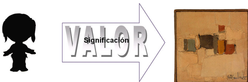
Figura 4. Significación a través de la valoración

Es interesante recordar aquí la clasificación de valores de Riegl (1987), que aunque superada en lo que a interpretación del patrimonio refiere, ofrece una clasificación dicotómica en base al proceso clave de transmisión; así existen valores de antigüedad y de contemporaneidad, haciendo hincapié en la importancia de la enculturación del patrimonio, distingue el autor, dentro de los valores rememorativos el valor de antigüedad, histórico, y rememorativo intencionado; y dentro de los valores de contemporaneidad el valor instrumental y el artístico (Riegl, 1987). Desde una perspectiva interpretativa más contemporánea Ballart establece, en base a la clasificación propuesta por Lipe 8 , tres categorías: valor de uso relativo a su utilidad, valor formal en cuanto a sus cualidades materiales y valor simbólico-significativo en cuanto a su capacidad evocadora y asociativa (Ballart, 1997). Fontal amplía la clasificación de Ballart describiendo cinco categorías: el valor de uso asociado a la utilidad; valor material en cuanto a sus cualidades físicas; simbólico o relacional relativo a su carácter evocador y comunicativo; valor histórico en cuanto a su capacidad reveladora del pasado y valor emotivo asociado a la afectividad para con el bien (Fontal, 2003)