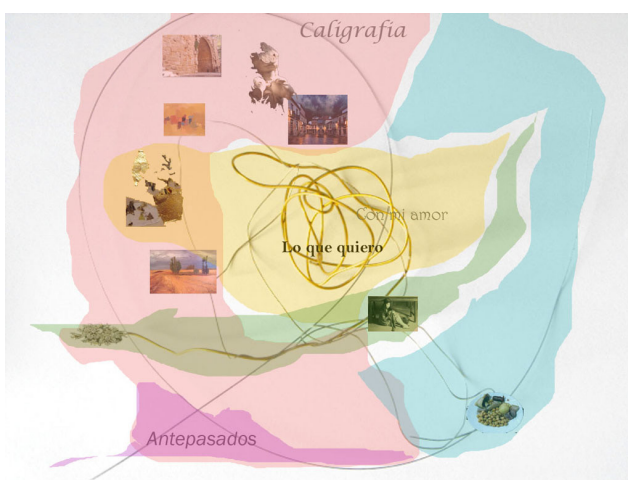
Figura. 3. Interpretación plástica de un mazeway

El mazeway, más ambicioso aún que el mapa conceptual, ya que el mazeway conecta entorno e individuo, es el sistema equivalente al sistema cultural, la estructura mental que reproduce la estructura cultural. Es la forma del orden 3 , si cada individuo debiera construir una red tridimensional de vínculos entre cosas 4 que lo conforman, se podría observar (o no, ya que es puramente relativo a cada cultura e individuo) algo así como una nube de conexiones, donde variarían la cantidad de enlaces unidos a cada cosa, así como su grosor y longitud; además habría cosas más cercanas entre ellas, o más lejanas, o unidas con el mismo tipo de conexión e incluso capas, burbujas, líquidos base y un sinfín de recursos que ayudarían a comprender esta complejidad. Así pues, desde aquí, entendemos el mazeway más como una red tridimensional que como un mapa bidimensional pero compartiendo la base de estructura organizativa compleja y ligada a diversas dimensiones del individuo como unidad.