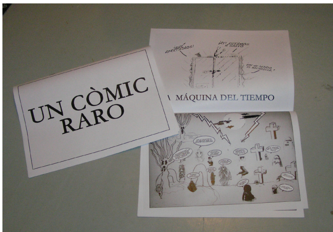
Fig. 5 y Fig. 6