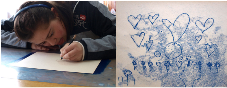
Fig. 11 y Fig. 12: Yesenia, 15 años