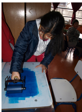
Fig. 1. Entintado de una plancha de acetato para realizar una monotipia. Autor: Javier Albar

La monotipia es una transferencia de tinta de grabado de la superficie de una plancha sobre la superficie del papel mediante diferentes métodos de presión. La finalidad de la monotipia no es realizar una serie, sino una sola estampa, variándose la intencionalidad final cualitativamente y no cuantitativamente, permitiendo un amplio terreno en la experimentación, con lo cual el esfuerzo se centra en una sola prueba original y no en el trabajo mecánico de realizar una edición perfecta. La monotipia siempre dará resultados diferentes a las técnicas tradicionales o al dibujo, produce elementos de sorpresa al ver como se transforma la imagen o se rompen las líneas, también permite interesantes fondos y texturas.