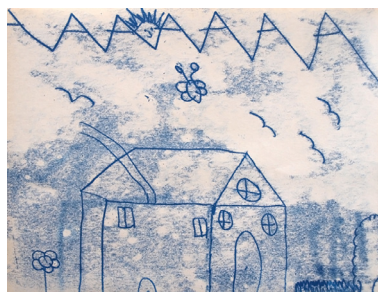
Fig. 9 y Fig. 10: Vivián, 13 años