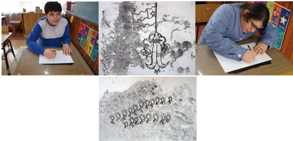
Fig. 13 y fig. 14 Sebastián 16 años y Fig. 15 y fig. 16: Maribel, 18 años