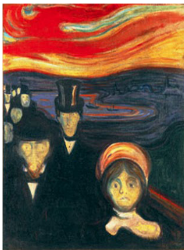
Figura 1. Ansiedad, Munch, 1894. Los rostros pálidos, los gestos crispados o el ambiente distorsionado son elementos creativos que sugieren agitación y desasosiego en el sujeto receptor.

En un estudio anterior, Flaherty (2004) vincula las disfunciones del lóbulo frontal con el bloqueo creativo –esto es, la falta de ideas originales–. La depresión es un trastorno que está asociado, precisamente, a un funcionamiento anómalo de esta región cerebral y, a menudo, se manifiesta en una falta acusada de motivación y flexibilidad cognitiva. De hecho, cuando la depresión es tratada clínicamente, se ha observado que las funciones del lóbulo frontal se normalizan en las pruebas de imagen funcional (Goldapple et al., 2004).