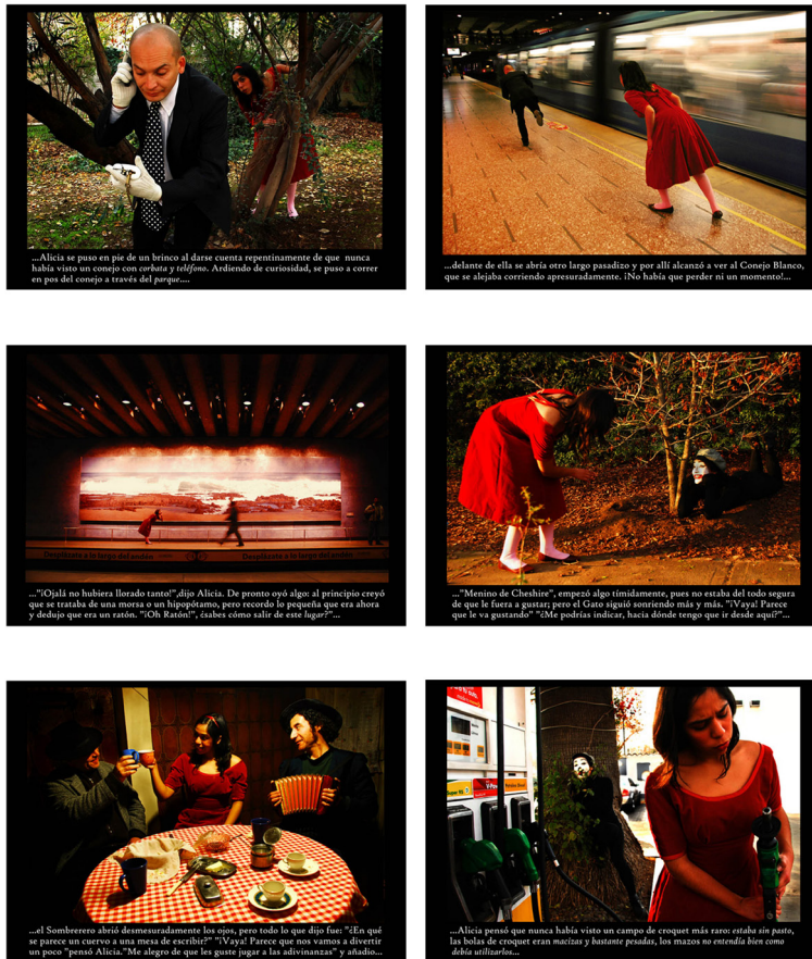
Figura 3. Alicia es un cuento, Natalia Lozano, 2008

Esta obra ha sido reconocida con diversos premios como el primer premio en la modalidad de fotografía en la 8ª Edición Valencia Crea 2008, además de participar en diversas exposiciones como en la Exposición colectiva en el Festival Valetudo Artístico 3, 2008.