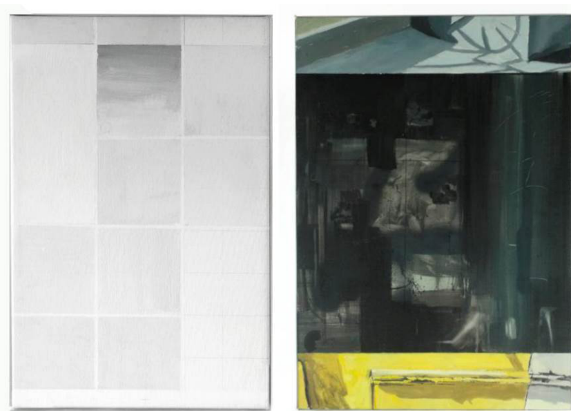
Figuras 2 y 3. Detalle de obras.

Paula Rubio es graduada en Bellas Artes por la Universidad de Murcia y actualmente cursa un Máster en Gestión y Producción Artística. Su práctica se centra en la pintura, abordando las nuevas dinámicas de la imagen y cuestionando su estatuto contemporáneo desde una perspectiva formal y procesual que reflexiona sobre la especificidad del medio. Entre sus méritos se cuentan su participación en exposiciones colectivas en Segovia, Granada y Murcia, haber sido seleccionada en la XXV edición de los Premios de pintura de la Universidad de Murcia y la beca obtenida en el Curso de Pintores Pensionados del Paisaje de Segovia, donde consiguió la medalla de bronce en 2024.