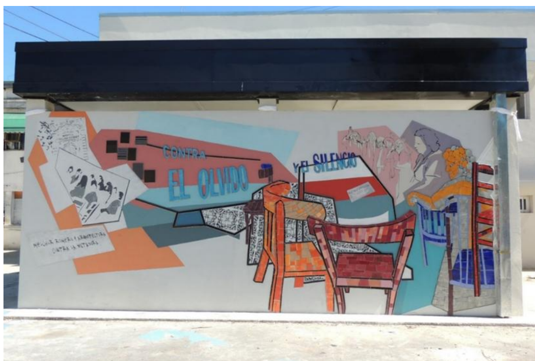
Figuras 1. Colectivo de artistas, FDA (UNLP). Mural Contra el Olvido y el Silencio , 2018. CICOP, Hospital Alejandro Korn.

Los/as artistas dividieron las “escenas” en dos sectores: “pasado” y “presente”. Las asambleas constituyen el motivo principal de la obra y ocupan todo el cuadrante derecho y parte del izquierdo (Fig. 1 y 2). Sillas, mesas y personajes -algunos realizados en mosaico- entrecruzan pasado y presente de la organización y lucha sindical.