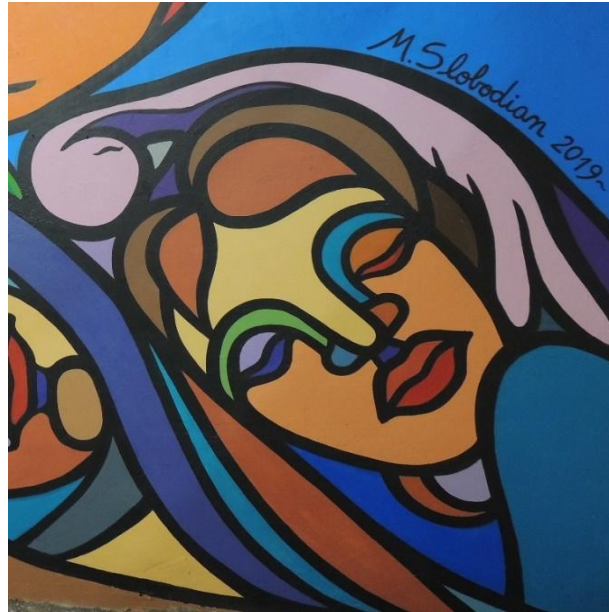
Figura 8. Detalle. La niñez y la libertad (pájaro). Fuente: elaborada por autora, 2019.

El “presente” y el “futuro” se representan en los extremos del mural y sus figuras fueron trabajadas con tonalidades más cálidas en contraste con el sector del pasado. En el cuadrante superior derecho, una mano sostiene un diente de león cuyas semillas, impulsadas por el viento, aluden al legado que se proyecta hacia el porvenir y se activa en el presente. En el extremo izquierdo, el presente se encarna en una figura femenina que, según la artista, simboliza la revisión histórica emprendida por la institución; la vela que sostiene representa la luz arrojada sobre los acontecimientos. Un detalle abrió el debate: de los ojos entrecerrados caían tres lágrimas (Fig. 9). Ante la consulta de una integrante de la Comisión, la artista respondió que expresaban “empatía” y defendió una estética del horror capaz de conmover al espectador: