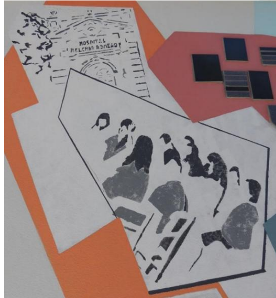
Figura 3. Detalle, estenciles fachada antigua del hospital y asambleas de trabajadores/as. Fuente: elaborada por autora, 2018.

Una situación semejante se observó en el caso del Colegio de Psicólogos/as.