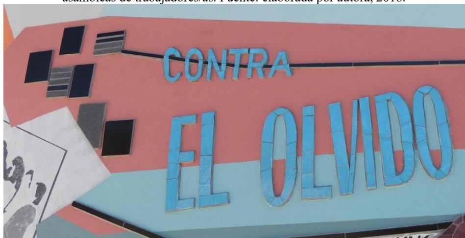
Figura 4. Detalle, representación abstracta de desaparecidos/as y asesinados/as, placas rectangulares en negro y gris.