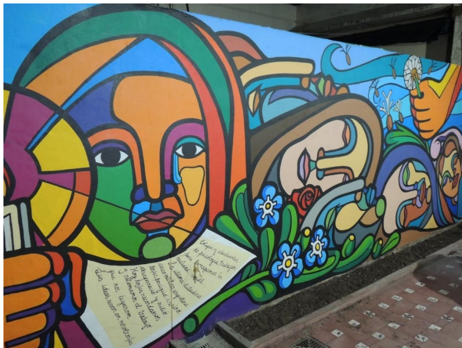
Figura 7. Melina Slobodián, mural Patio de la Memoria , 2019. Colegio de Psicólogos/as.

La artista explicitó el “simbolismo” de los elementos iconográficos y señaló que la obra articula pasado, presente y futuro como temporalidades interconectadas (Fig. 7). Formalmente, la composición se organiza mediante gruesos contornos negros que delimitan planos cromáticos plenos y vibrantes. En el sector del pasado aparecen los/as desaparecidos/as: grandes rostros no realistas y superpuestos, femeninos y masculinos, con los ojos cerrados y apenas diferenciados entre sí. Nadie objetó su representación como muertos/as. En el cuadrante inferior derecho se distingue un niño, de menor escala, abrazado por un pájaro que, según la artista, simboliza la muerte de la libertad junto con las personas (Fig. 8). Aunque no hubo niños/as directamente vinculados/as a la institución, Melina justificó su inclusión por el impacto de la dictadura sobre las infancias, dimensión escasamente representada. La Comisión valoró esta decisión por incorporar una perspectiva generacional que amplía las huellas del terrorismo de Estado: la destrucción familiar, las detenidas embarazadas y los/as bebés no nacidos/as o apropiados/as.