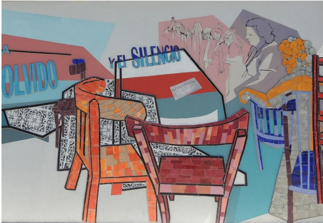
Figuras 2. Colectivo de artistas, FDA (UNLP). Mural Contra el Olvido y el Silencio , 2018. CICOP, Hospital Alejandro Korn.

El mural adopta un estilo cubista ya que la mayoría de sus elementos se componen de figuras geométricas fragmentadas y superpuestas en un mismo plano, vistas desde múltiples perspectivas simultáneamente. Esto se observa en el piso rebatido del Hospital -realizado con estenciles que reproducen los cerámicos originales-, en la disposición de las sillas (de frente y perfil) y en la mesa, que roza la abstracción. La profundidad es escasa y se construye en la serie de mujeres proyectadas en el cuadrante superior derecho. La lucha de los/as trabajadores/as aparece también en estenciles basados en fotografías de asambleas (Fig. 3), junto a uno con la fachada antigua del Hospital y otro que reproduce un recorte periodístico con el titular: “Los empleados del Hospital Melchor Romero tomaron hoy el establecimiento”, que sitúan espacialmente la escena. Sin embargo, no se incorporaron referencias temporales. A ello, se suma la particular representación de los/as siete desaparecidos/as y asesinados/as identificados/as durante la investigación. A diferencia del acto inaugural del 19 de marzo de 2018 -donde se proyectaron sus fotografías-, en el mural se optó por evocarlos mediante siete placas cerámicas rectangulares de color negro y gris (Fig. 4). Esta composición abstracta surgió del consenso entre artistas y la Comisión, en diálogo con la información disponible y las implicancias éticas y legales de la representación. Evelyn Vidaurreta y Julia Ferraris explican: