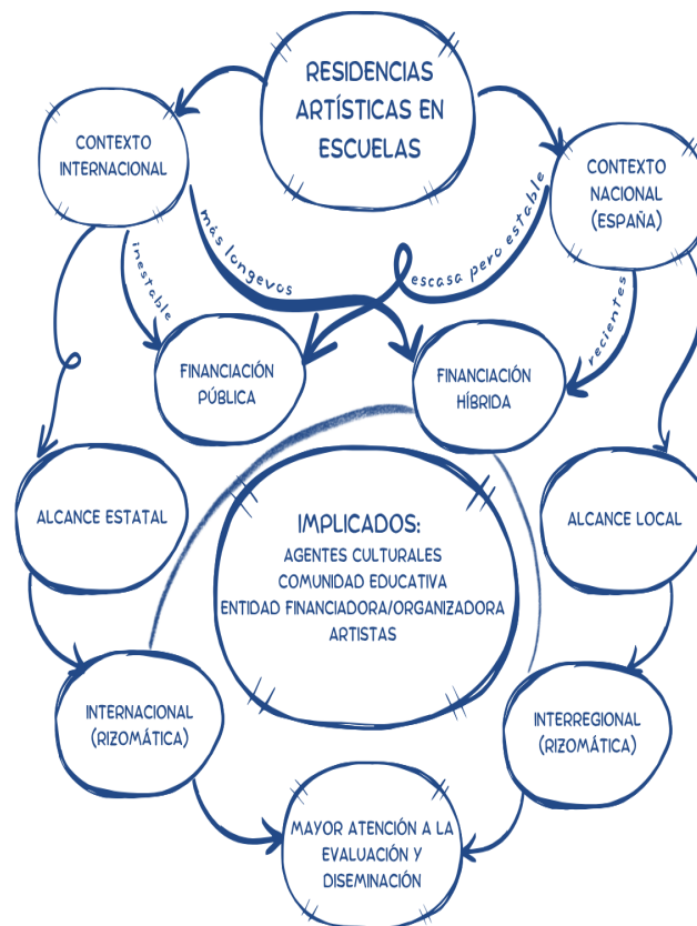
Figura 1. Borisova Fedotova, A., Esquema conceptual de las tendencias en la evolución de los modelos de residencias, 2025 (Elaboración propia).

Entre los retos que están por afrontar en el ámbito de las residencias artísticas en escuelas está asegurar el reconocimiento institucional de esta labor como producción artística. A pesar de que los primeros programas de este tipo surgieron hace 5 décadas, las creaciones realizadas en su curso siguen sin considerarse obras de arte. Resulta bastante sorprendente, ya que el paradigma artístico contextual surge prácticamente al mismo tiempo que estos programas y enmarca a la perfección sus aportaciones. En estas condiciones, el trabajo realizado por un artista durante la residencia se sitúa en el terreno de nadie: ni es arte, ni tampoco una labor docente reconocida como reglada, una situación poco ventajosa para aquellos que desean profundizar en este campo.